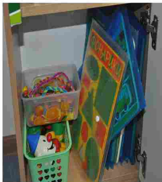
При _____ Уголок для констру _____ деятел _____