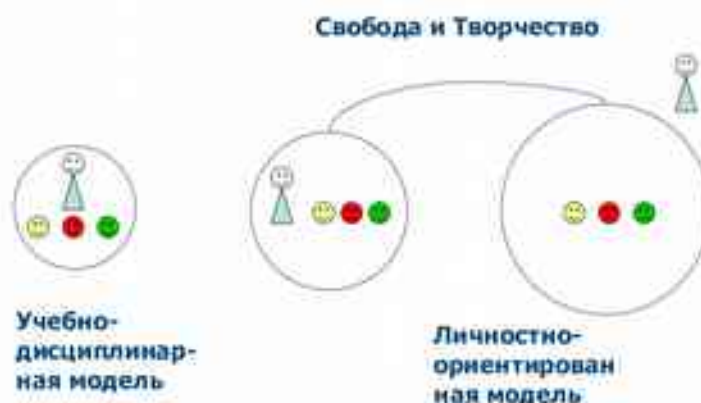
Схема 1. Стратегии образования в Программе

При таком подходе образовательный процесс в детском саду условно разделяется на три составляющих, каждой из которых соответствует определенная позиция обучающего взрослого: