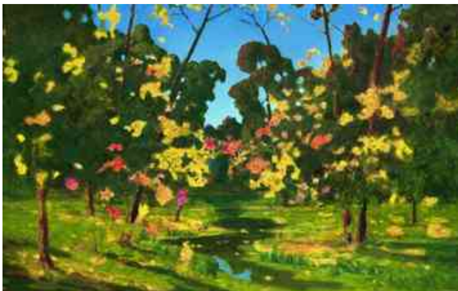
Рисунок 1. Архип Иванович Куинджи «Осень»

Педагог показывает детям репродукцию картины Архипа Ивановича Куинджи «Осень» (См. Рисунок 1), дает краткое описание произведения изобразительного искусства по схеме (См. Приложение 12).