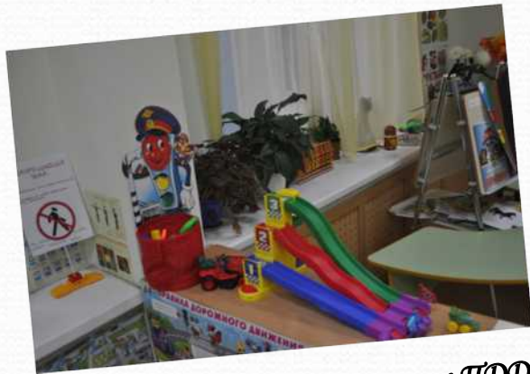
Конкурс в ДОО «Лучший уголок ПДД»

На протяжении учебного года в детском саду проводились различные конкурсы для педагогов, детей и их семей.