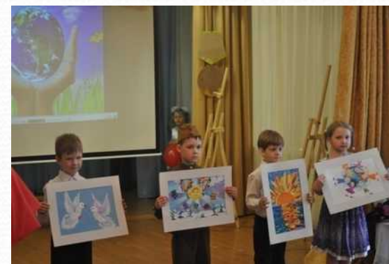
Диплом I степени в номинации «Литературно-музыкальный монтаж» (композиция «Мы рисуем этот мир...») в рамках ФДДП «Солнечный круг», (МО «Озеро Долгое», апрель 2015 г.)