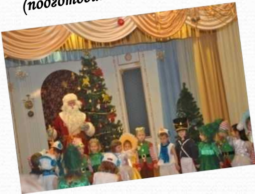
«Новогодние игрушки» (новогодний утренник в средних группах)