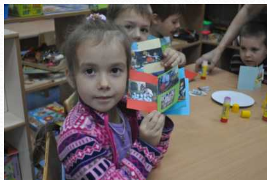
Проект «Сказки» (книжки-самоделки) (старшая группа №1)