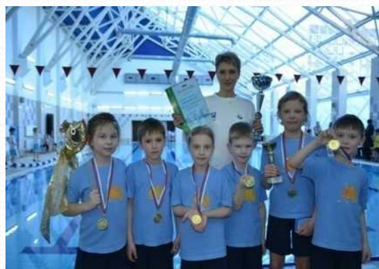
Победитель районных соревнований среди детей подготовительных групп «Праздник на воде» (апрель 2015 г.)