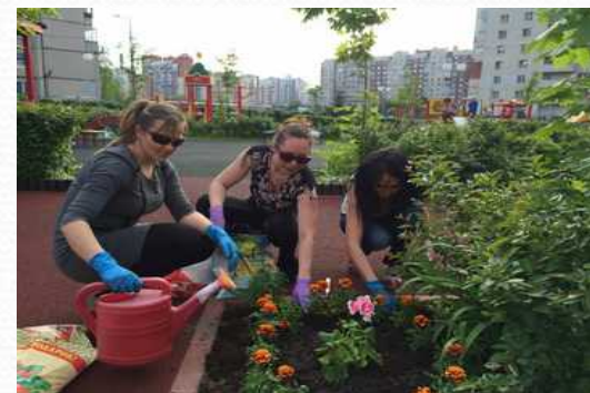
Конкурс клумб в ДОО «Цветы детям»