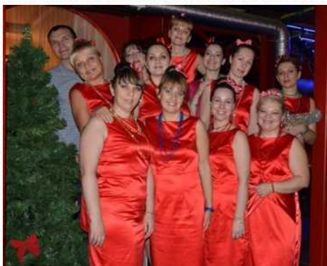
Диплом лауреата I степени в муниципальном конкурсе «Битва хоров» среди коллективов ТБОУ и ТБДОУ (МО «Озеро Долгое», декабрь 2014 г.)