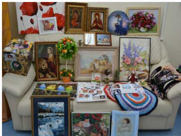
Выставка «Хобби пап и мам» (март 2015 г.)