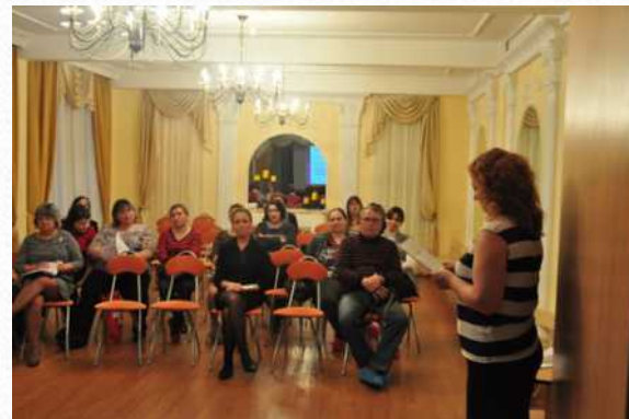
Районный научно-практический семинар «Инклюзивное обучение в саду общеразвивающего вида: проблемы и перспективы» (декабрь 2014 г.)