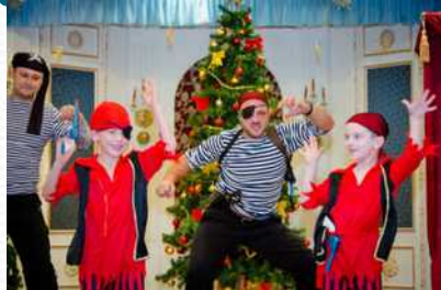
Участие родителей в утренниках и других мероприятиях детского сада