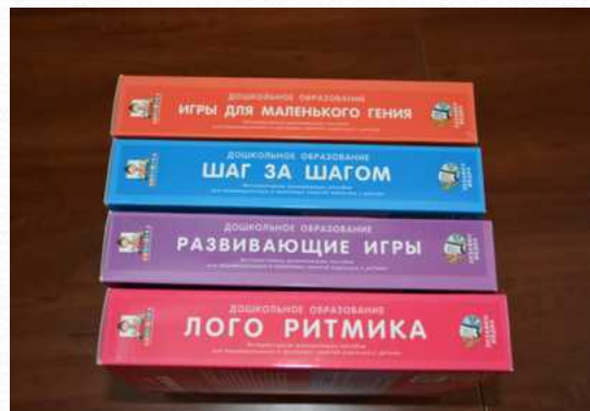
Комплект электронных развивающих игр