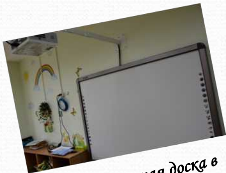
Интерактивная доска в средней группе №2