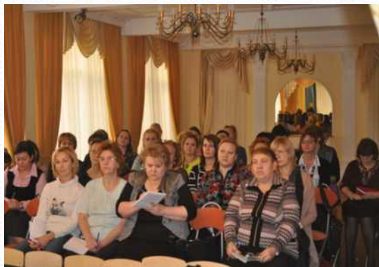
Районная консультация «Распространение педагогического опыта»

В ГБДОУ проводились 12 мероприятий различного уровня: районного, городского, всероссийского, являясь районной и региональной экспериментальной площадкой.