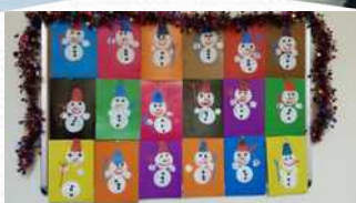
Конкурс в ДОО «Парад снеговиков»