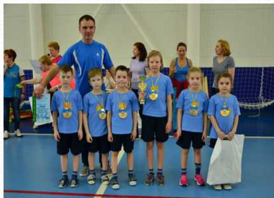
Призер районных соревнований среди ТБДОУ Приморского района «Веселые старты» (март 2015 г.)