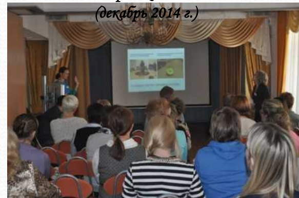
Городской научно-методический семинар «Командный подход как условие успешного оздоровления дошкольников» (апрель 2015 г.)