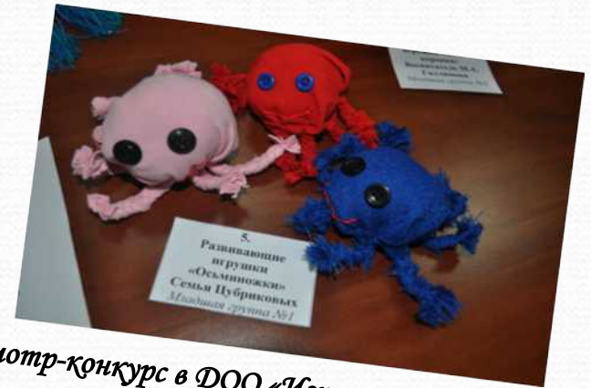
Смотр-конкурс в ДОО «Игрушки для развития речи»