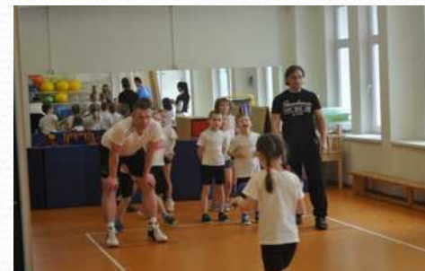
Интегрированное детско-родительское занятие