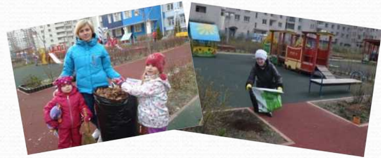
Осенний и весенний субботники