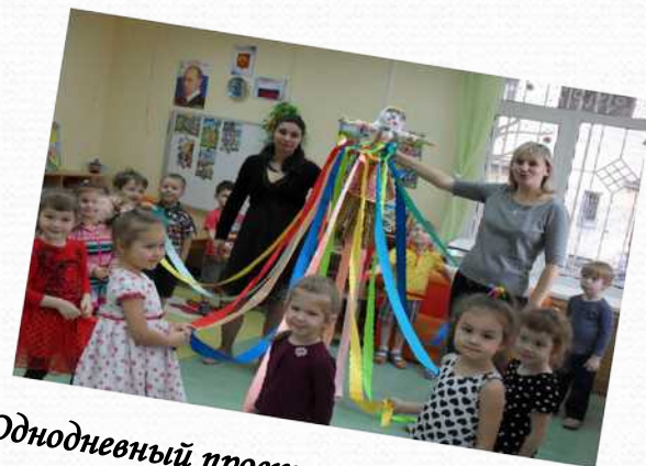
Однодневный проект «Проводы Масленицы» (младшая группа №1)