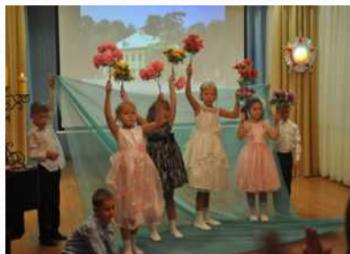
Танец «Цветы, ветеранам»