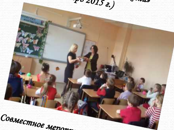
Совместное мероприятие со школой №644 Приморского района «Стихи ко Дню Победы»