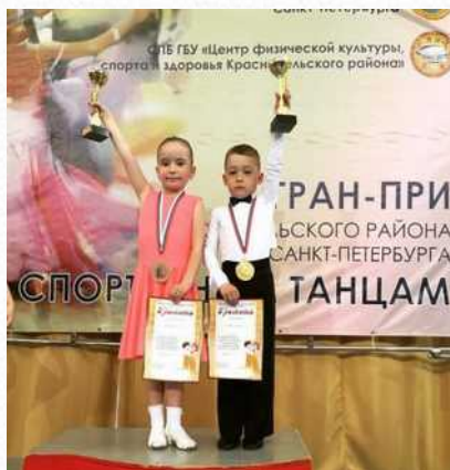
Победа воспитанников на городском конкурсе по спортивным балльным танцам (май 2015 г.)