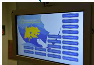
Информационный киоск для родителей в фойе