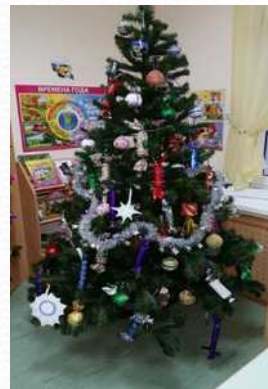
Конкурс в ДОО «Украсим группу к Новому году»