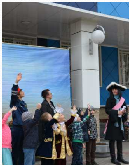
Научно-практический семинар «Система работы по обучению дошкольников правилам дорожного движения в контексте ФГОС ДО» (МО «Озеро Долгое», май 2015 г.)