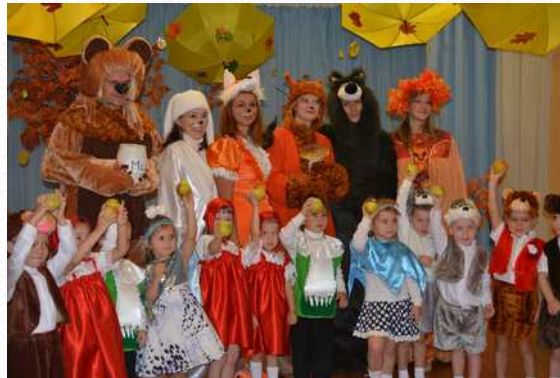
«Белочка» (осенний утренник в младших группах)