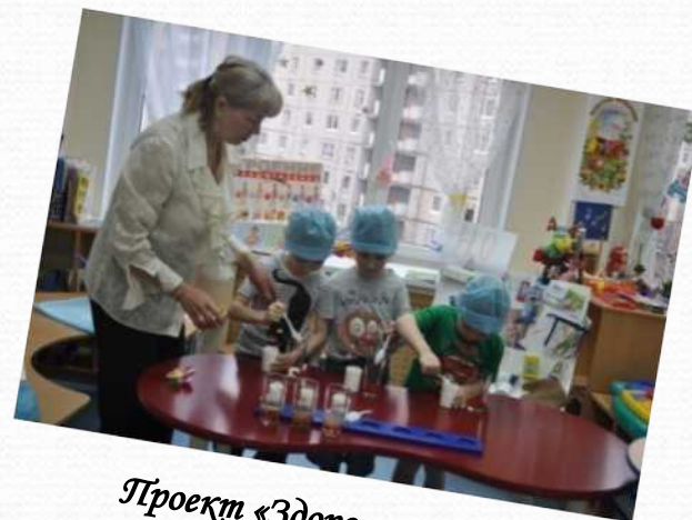
Проект «Здоровые зубы» (старшая группа №1)