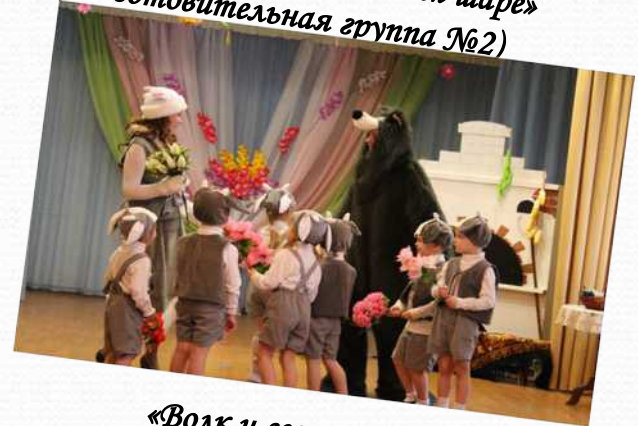
«Волк и семеро козлят» (весенний утренник в средних группах)