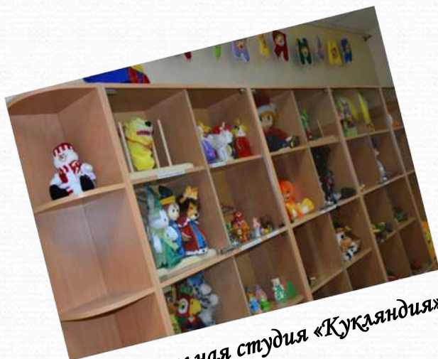
Театральная студия «Кукляндия»