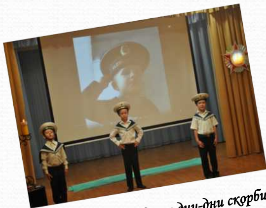
День памяти «Блокадные дни-дни скорби» (сентябрь 2014 г.)