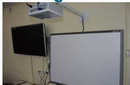
Интерактивная доска в зале совещаний