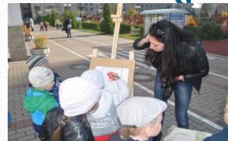
Совместное детско-родительское мероприятие на улице (сентябрь 2014 г.)