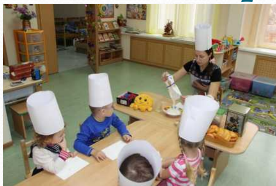
Проект «Возьми с полки пирожок» (средняя группа №1)