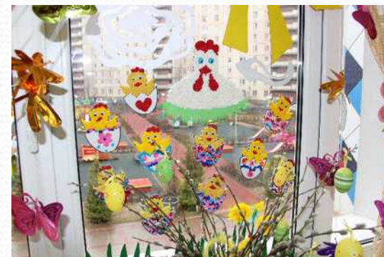
Конкурс в ДОО «Украсим окна. Весна идет!»