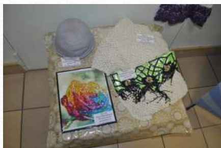
Выставка «Хобби педагогов» (ноябрь 2014 г.)