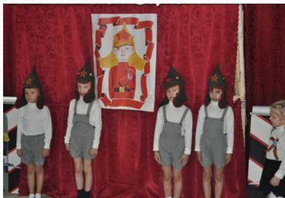
Спектакль «Мальчиш – Кибальчиш»