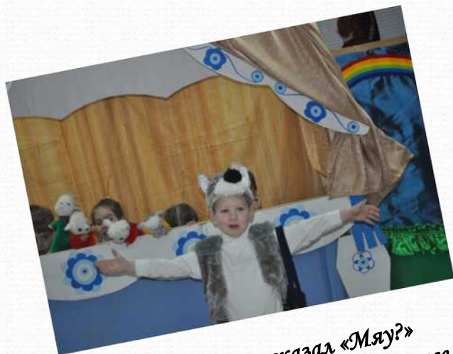
Спектакль «Кто сказал «Мяу?»» II место на муниципальном конкурсе «Фестиваль сказок»