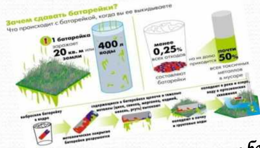
Эко-акция по сбору и утилизации батареек (апрель 2015 г.)