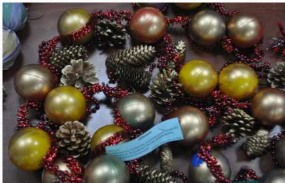
Районный конкурс «Новогоднее чудо» (МО «Озеро Долгое»)