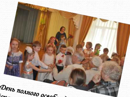
«День полного освобождения советскими войсками города Ленинграда от блокады его немецко-фашистскими войсками» (январь 2015 г.)