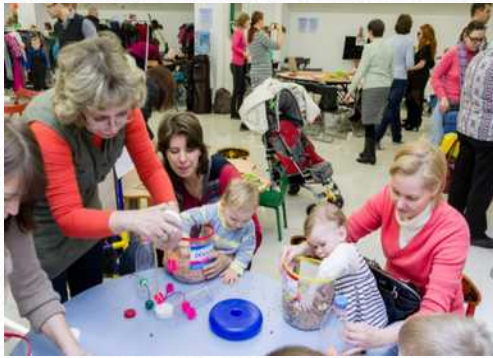
Участие в выставке «Потоша. Путь к здоровью» (январь 2015 г.)