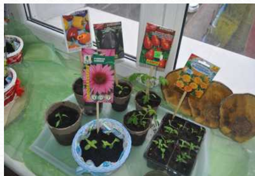
Конкурс в ДОО «Огород на окне»