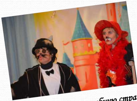
«Приключение в волшебную страну Знаний» (подготовительная группа №1)