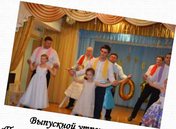
Выпускной утренник «Путешествие на воздушном шаре» (подготовительная группа №2)