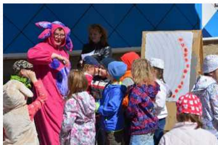
Интегрированное мероприятие на улице (июнь 2015 г.)