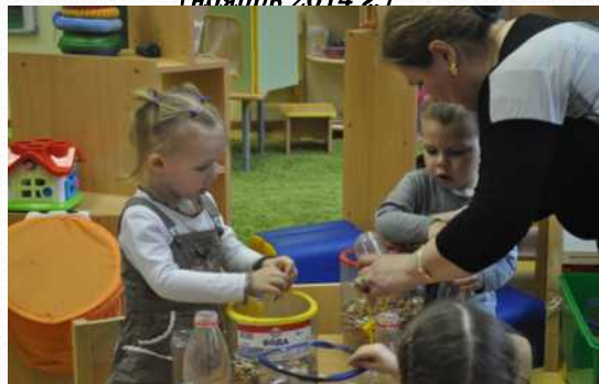
Секция на международной научно-практической конференции «Дошкольное образование в современном мире» (ЛОИРО, апрель 2015 г.)