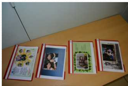
Конкурс «Семья года» (май 2015 г.)