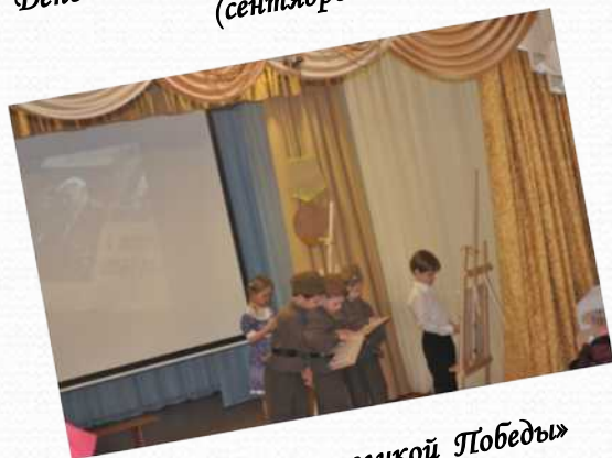
«9 мая-День великой Победы» (май 2015 г.)