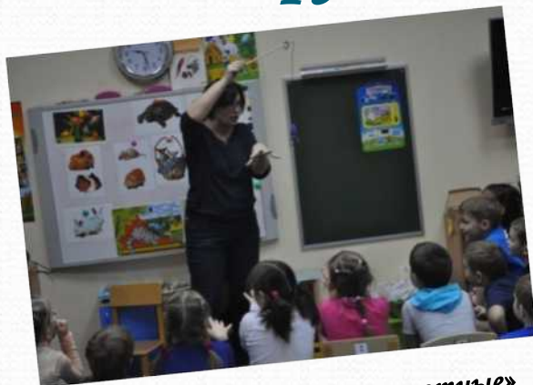
Проект «Домашние животные» (подготовительная группа №1)