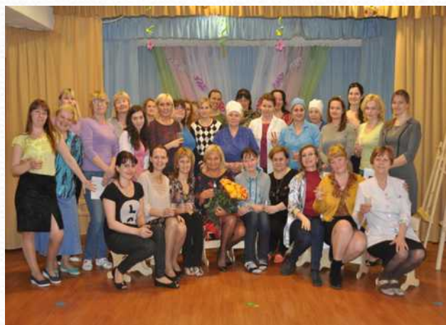
Наш звездный коллектив