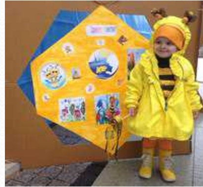
Акция «Сохраним пчелу - сохраним планету» (май 2015 г.)