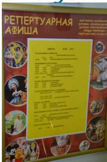
Театральная афиша в фойе детского сада