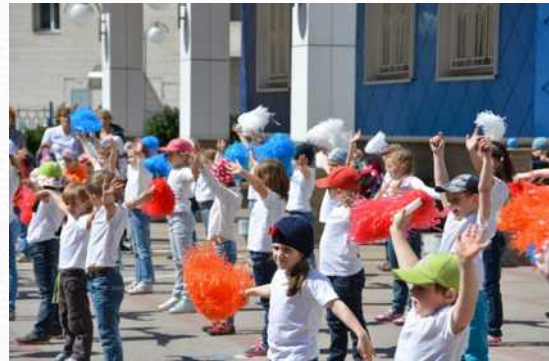
Танцевальный флешмоб на улице (хореограф – Максимова О.В.) (5 июня 2015 г.)