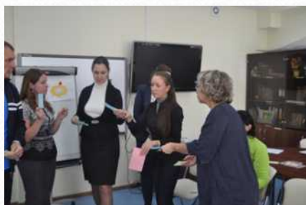
Обучающий тренинг с психологом для сотрудников (октябрь 2014 г.)