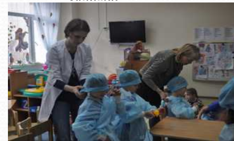
В гости к детям пришел врач-нефролог. (апрель 2015 г.)