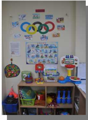
Конкурс в ДОО «Лучший физкультурный уголок»