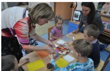
Мастер-класс по декупажу (сентябрь 2014 г.)