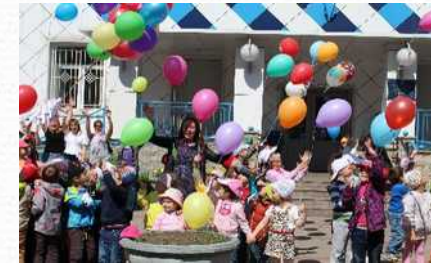
Участие во Всероссийском флешмобе «Должны смеяться дети» (1 июня 2015 г.)