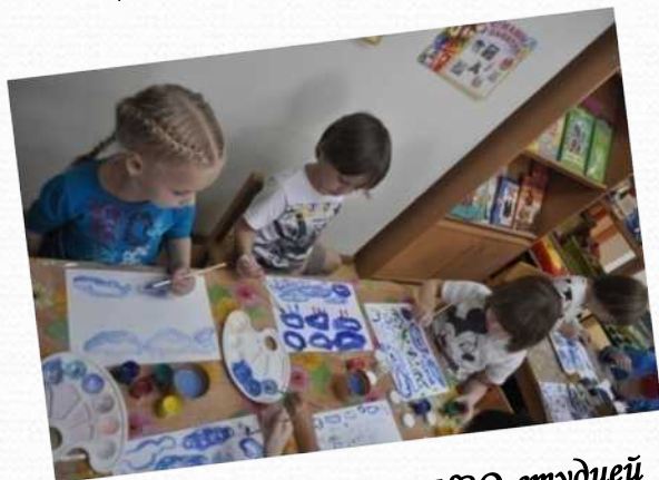
Совместный проект с ИЗО-студией (средняя группа №3)