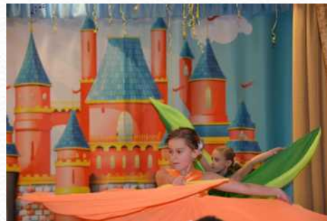
Выпускной утренник (подготовительная группа №1)