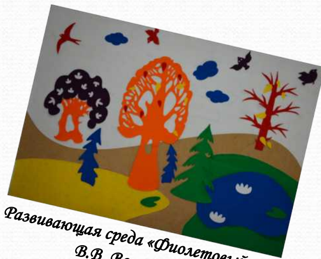
Развивающая среда «Фиолетовый лес» В.В. Воскобовича