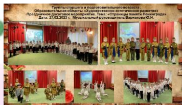
Коллажи с фоторепортажами и видеоотчёты о мероприятиях с участием родителей