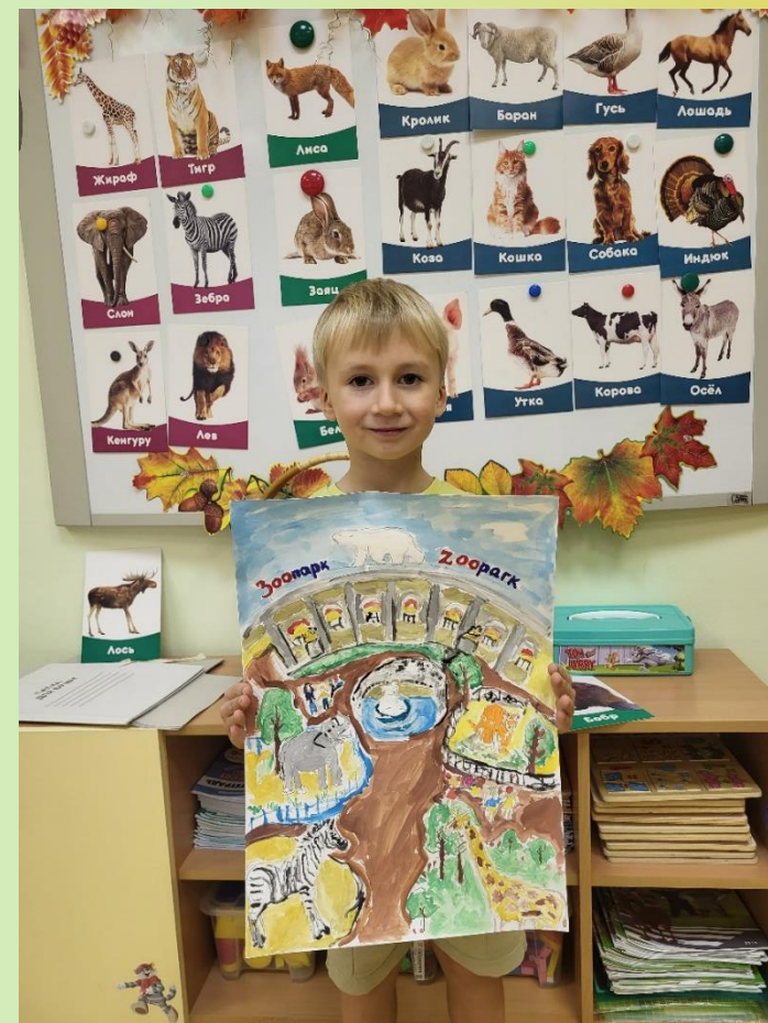
Выставка детского творчества «В мире животных»