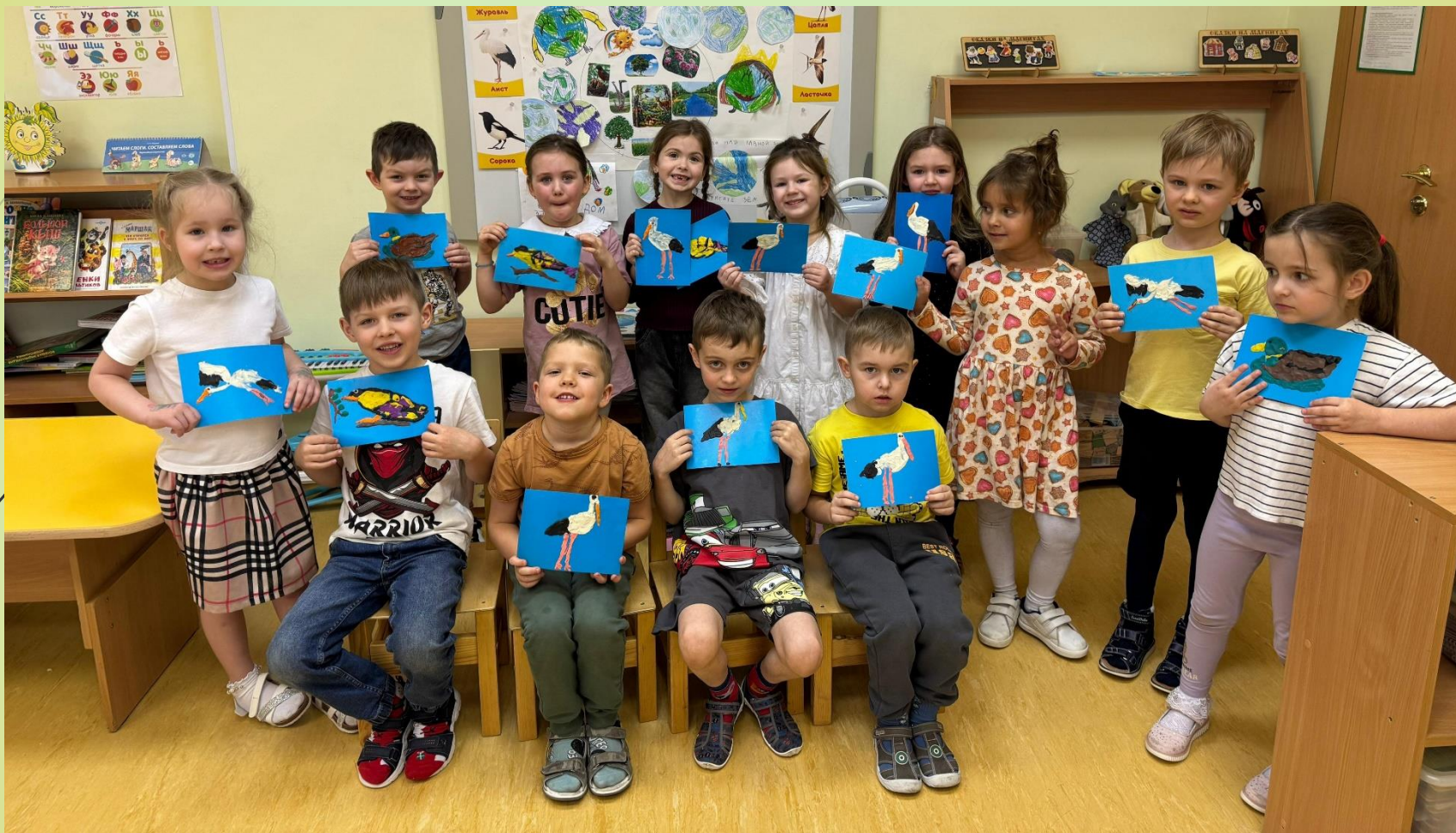
Выставка детского творчества «Перелетные птицы»