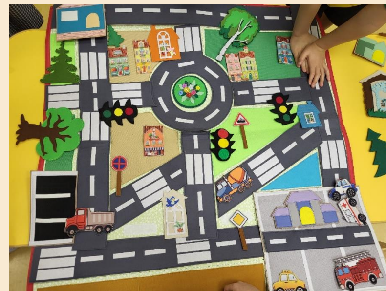
Беседа, инструктаж и игра на тему: «Наш безопасный маршрут»