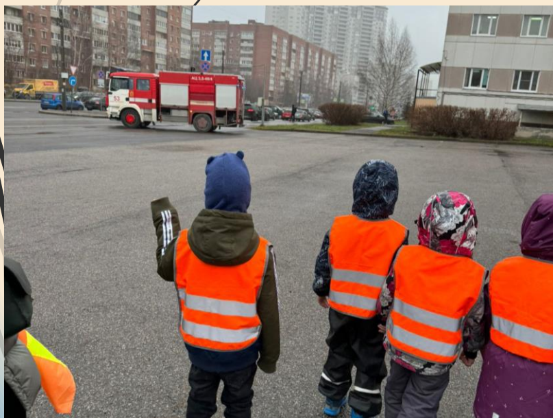
Ознакомительная экскурсия в пожарно-спасательную часть.