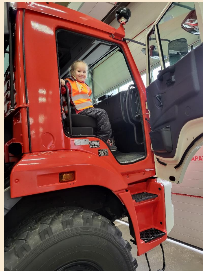
Фотографирование на память с пожарными.