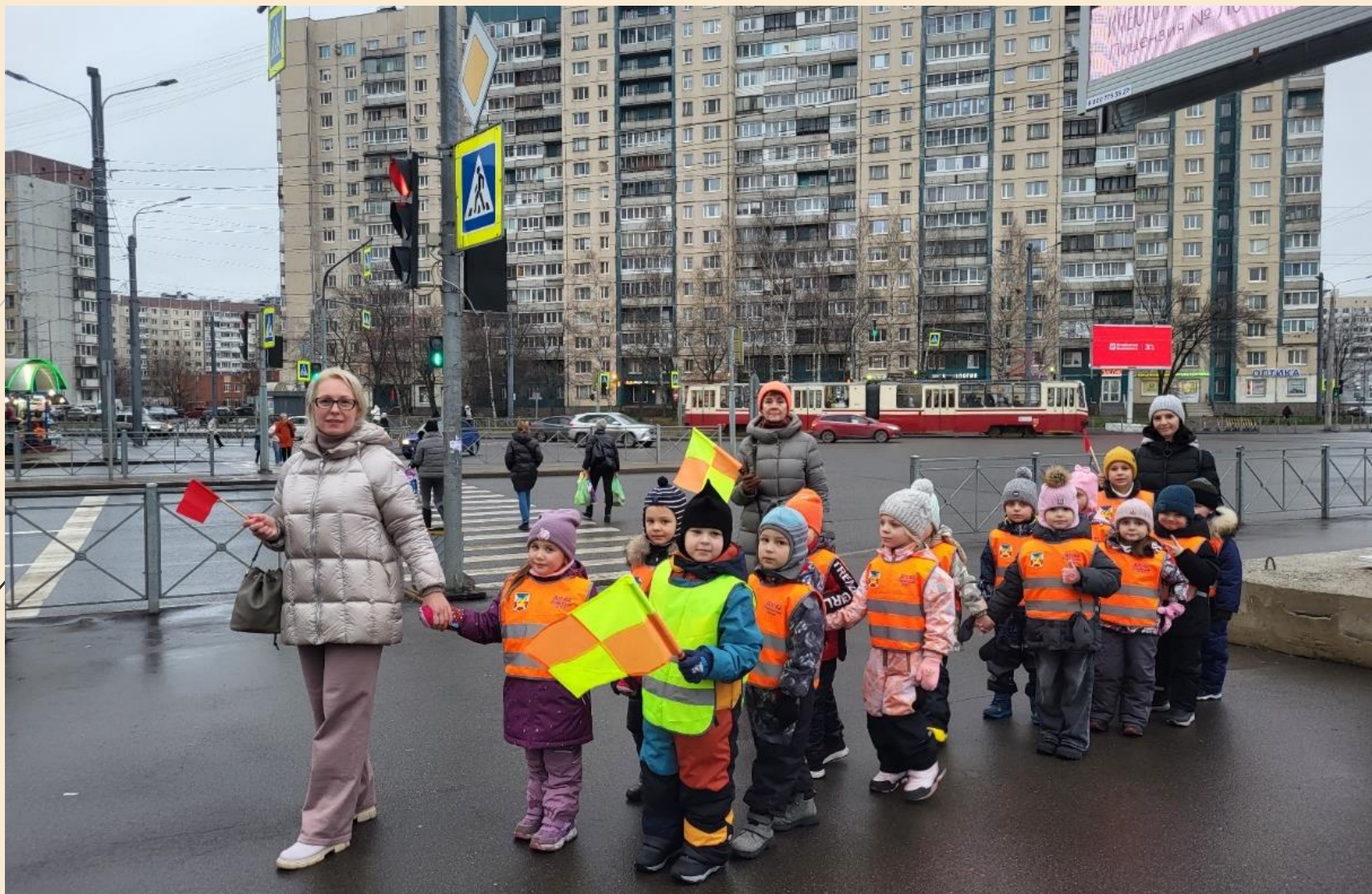
Прогулка по окрестностям микрорайона, наблюдения детей за объектами по дороге.