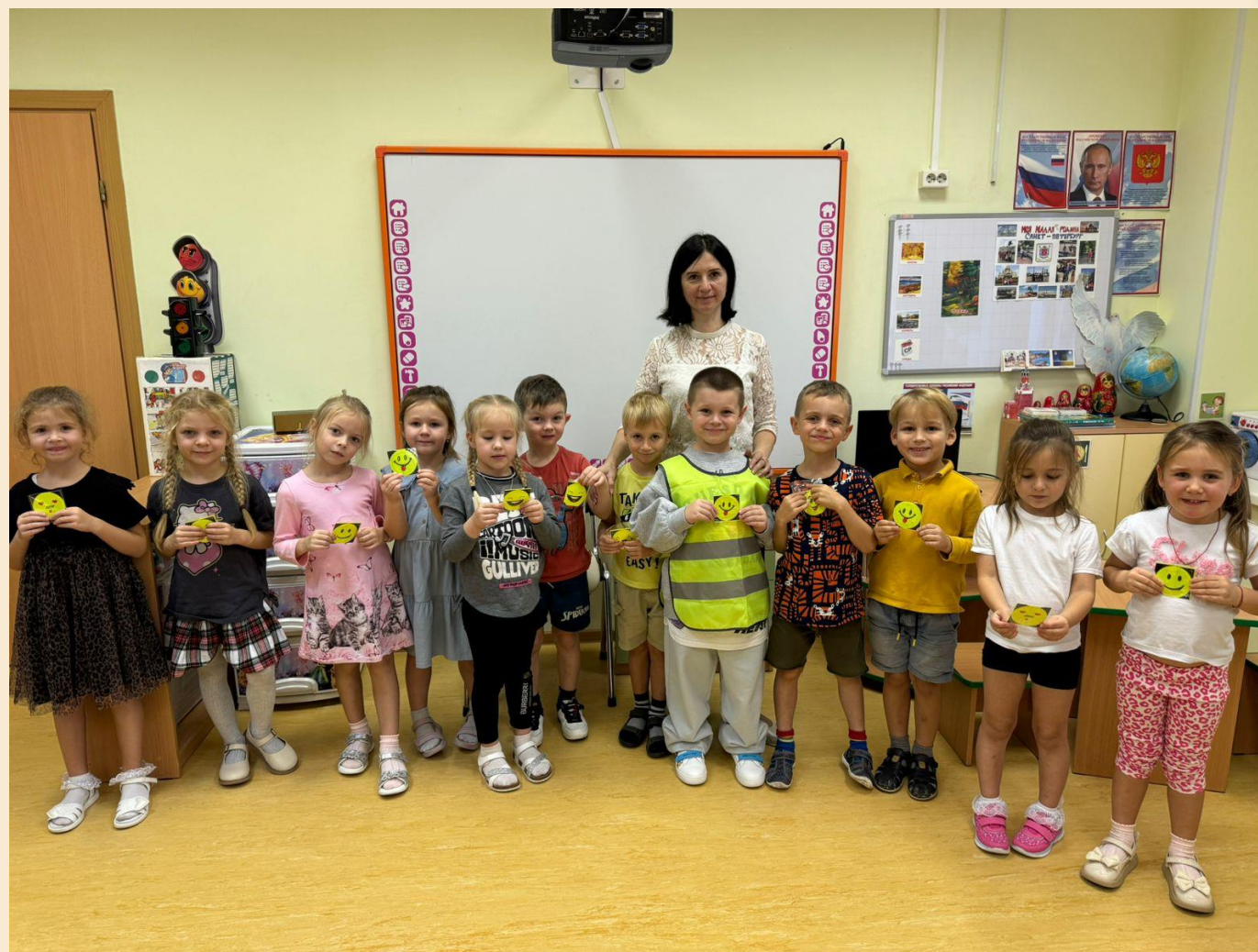
Сюрпризный момент: раздача детям световозвращателей для безопасных прогулок по городу.