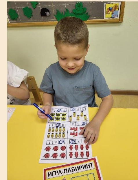
Рабочие листы «Построй по цифрам пожарную машину», игра-лабиринт «Тушим пожар» и пр.