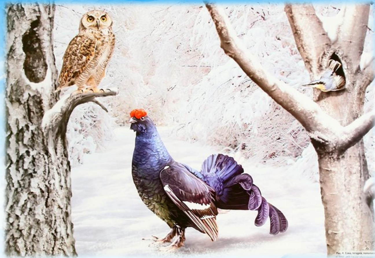
Рис. 4. Сова, тетерев, нутчатка.