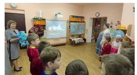
Перед исполнением гимна России...