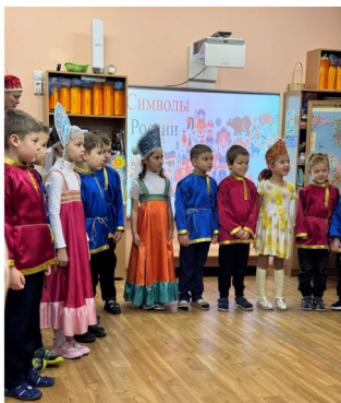
Открытое итоговое мероприятие «Символы России»