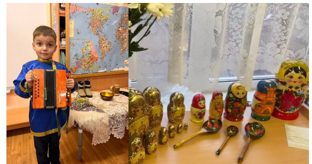
Создан мини-музей «Символы России»