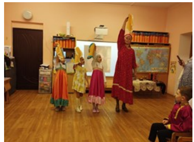
Дефиле с кокошниками