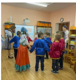
Хоровод «Во поле берёзка стояла...»