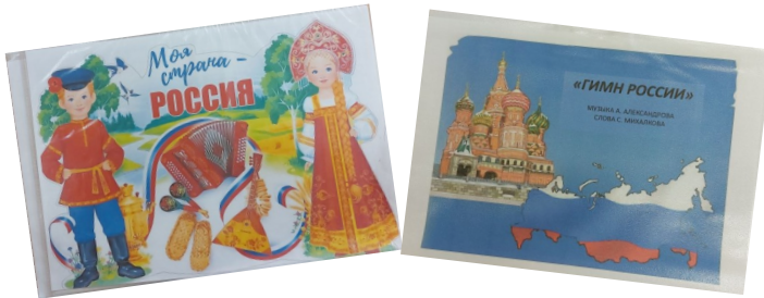
Созданы книги о символах России

Цель: формирование системных представлений о государственной символике родной страны у детей старшего дошкольного возраста.