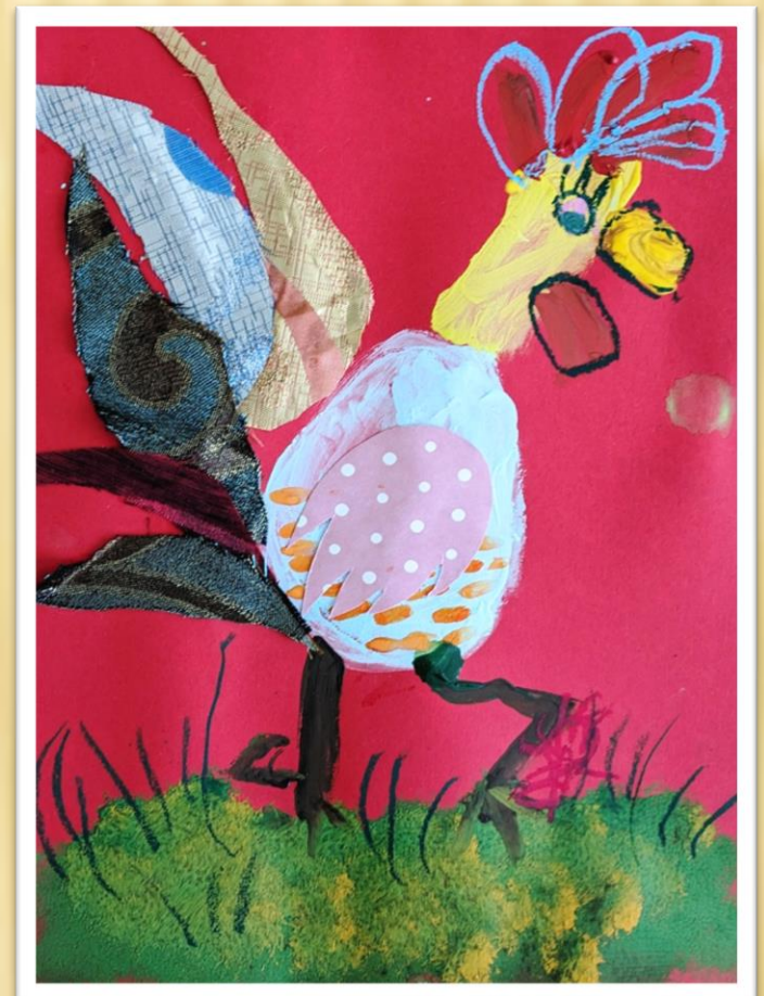
Нетрадиционные виды изобразительной деятельности- аппликация из разных видов ткани и рисование гуашевыми красками.