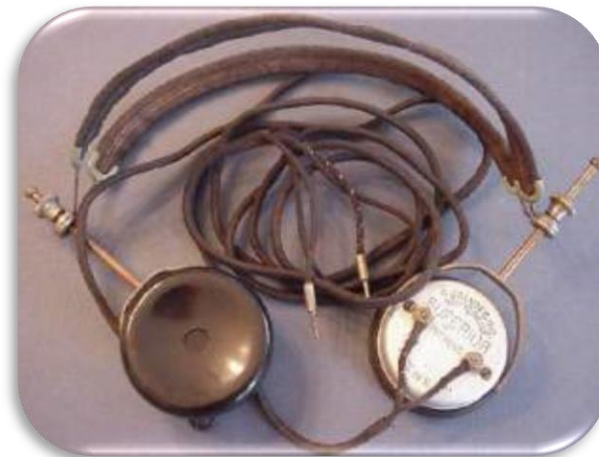
Наушники, изобретенные Б. Натаниэлем