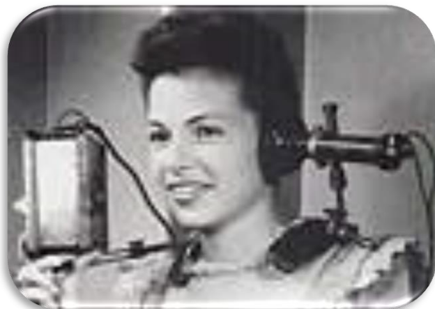
Снимок девушки в старинных наушниках