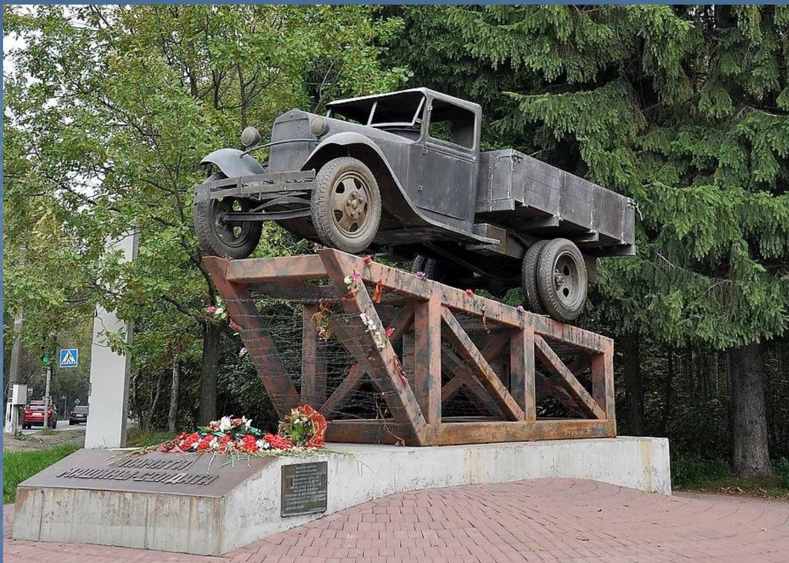
Памятник легендарной «полуторке». Город Санкт-Петербург