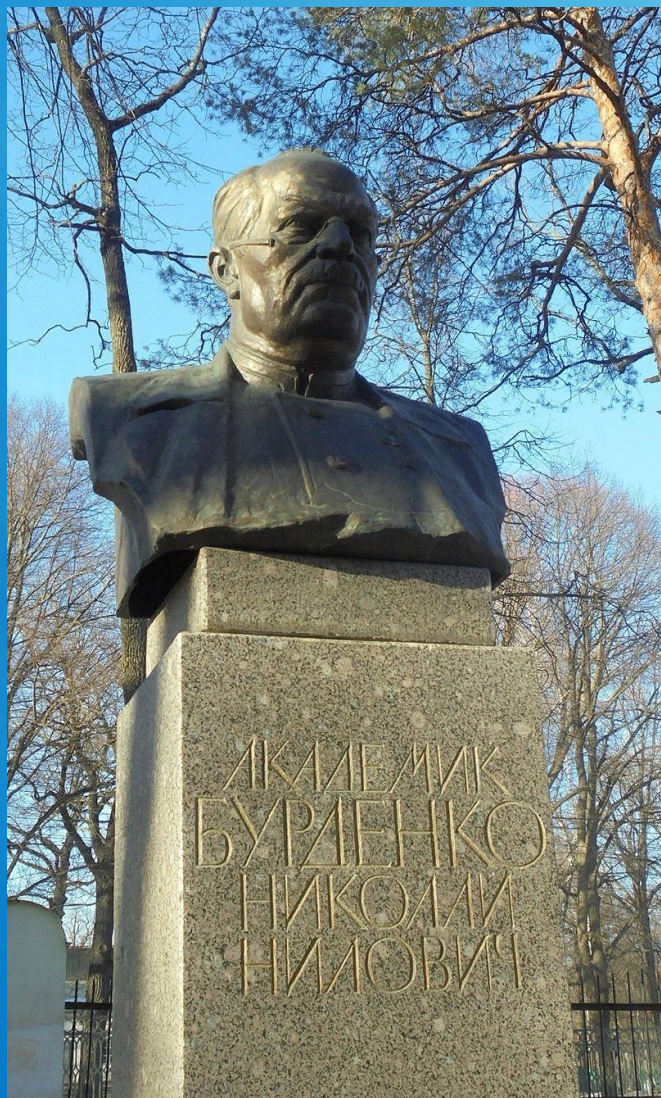
Бюст академика Н. Н. Бурденко, 1958 год

Имя Бурденко носят улицы в Москве, Могилёве, Новосибирске, Нижнем Новгороде, Воронеже, Пензе, Донецке, Челябинске, Волгограде, Химках: