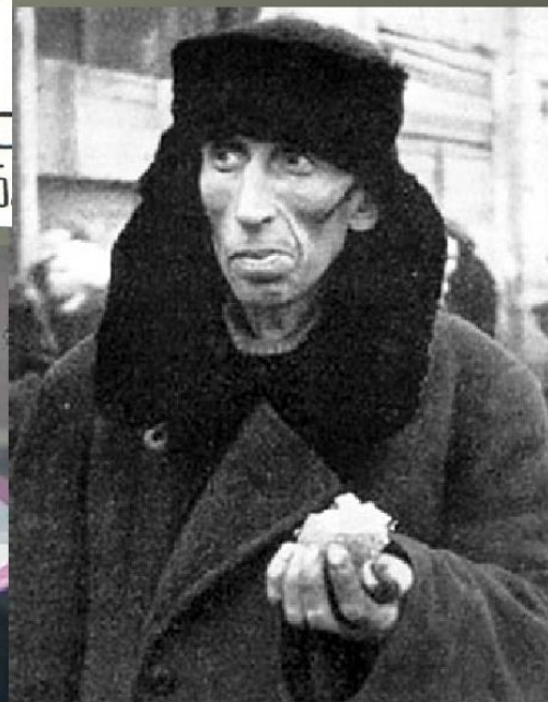
Норма хлеба (Музей «Хлеба» г. Санкт-Петербург)