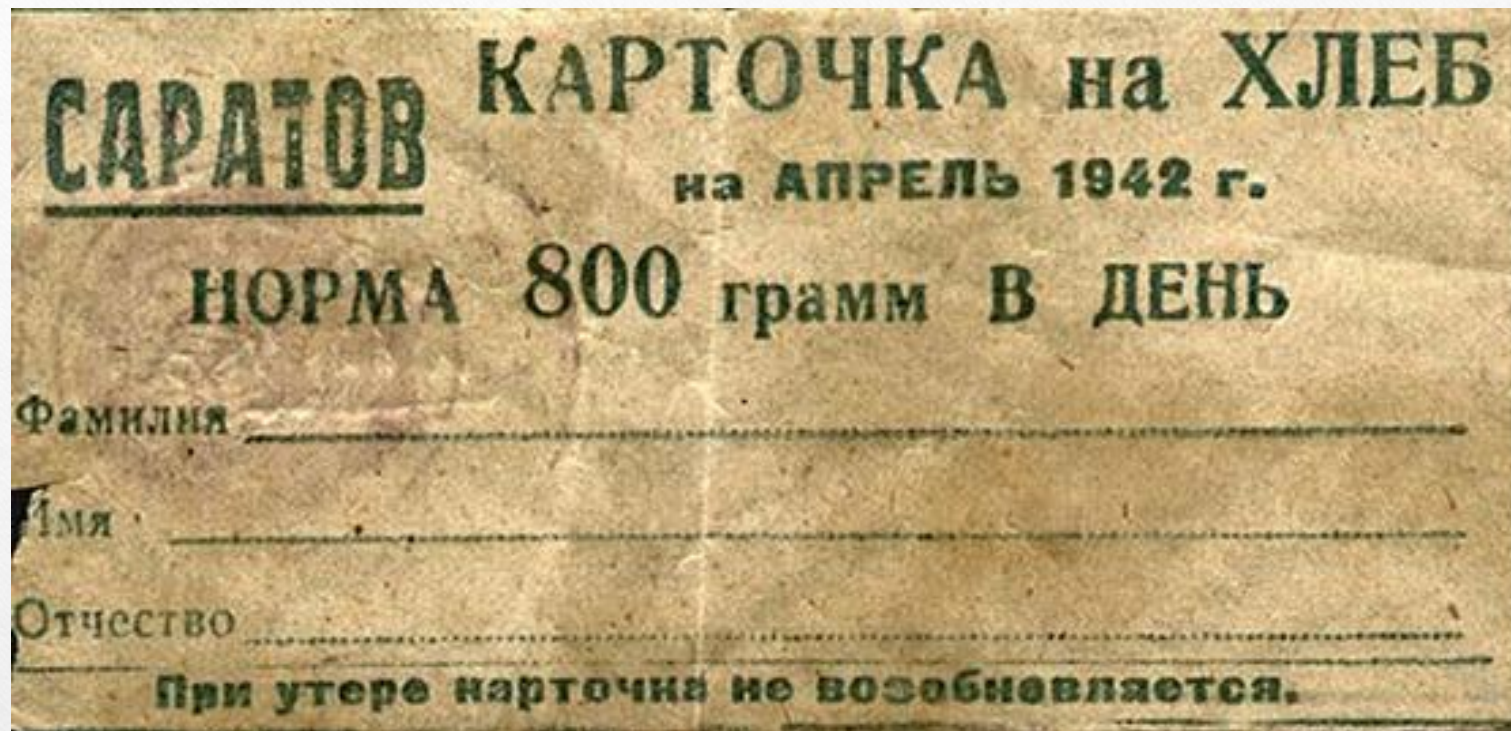
Карточка на хлеб в г. Саратов датированная на апрель 1942 года.