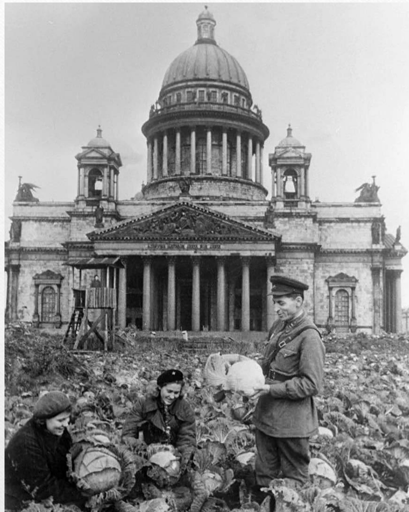
Огороды в городе Ленинград в годы блокады