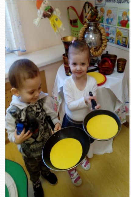
Традиционное празднование Масленицы