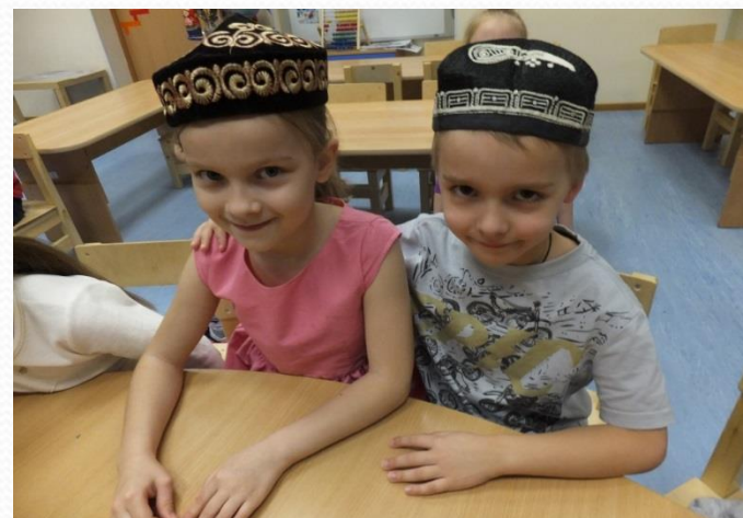
Проект «День народного единства» (подготовительная группа 1)