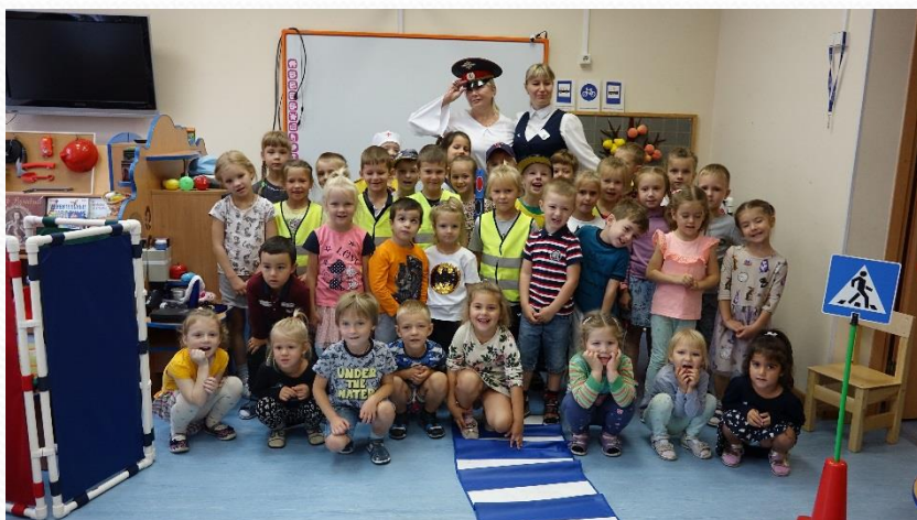
13.09.2019 г. Единый день ПДД «Внимание – дети!»