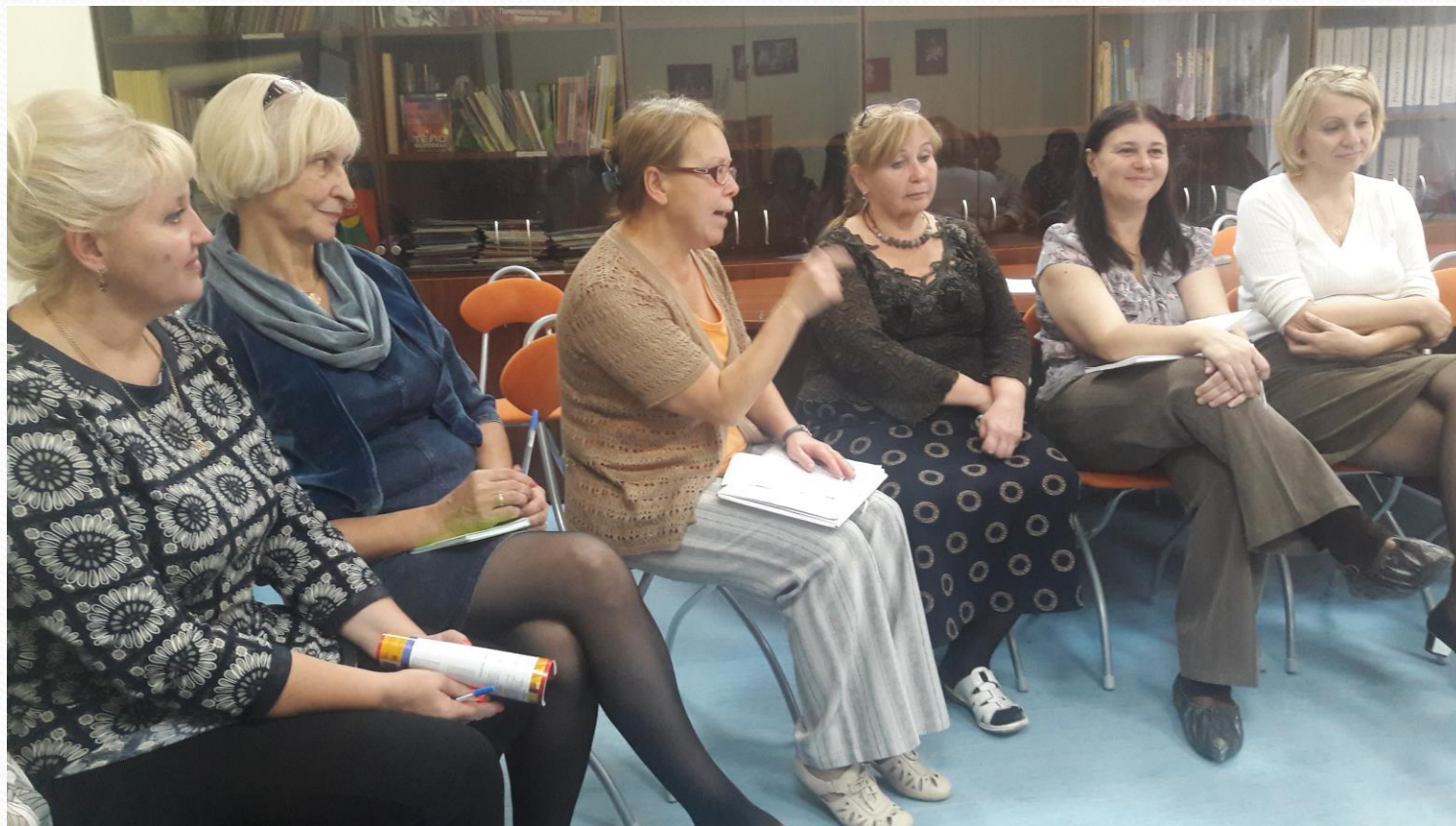
Творческая группа педагогов Приморского района «Школа тьютора»