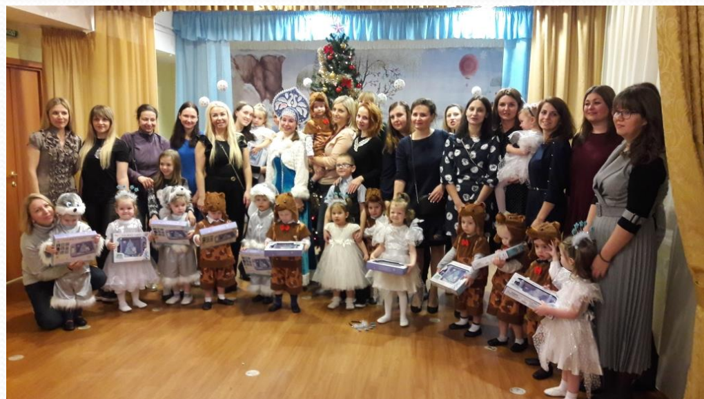
Новогодние праздники 2019г.