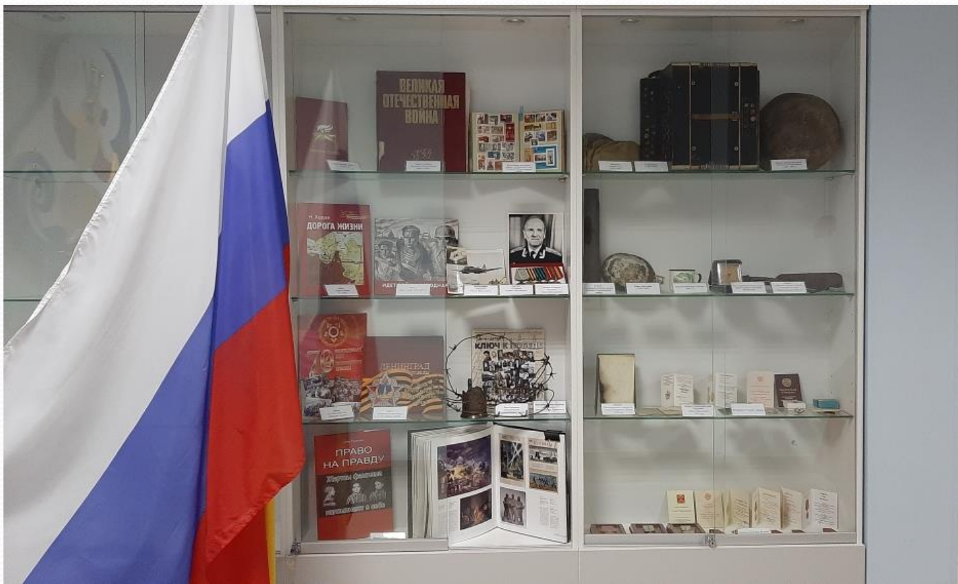
Музей «Память поколений»