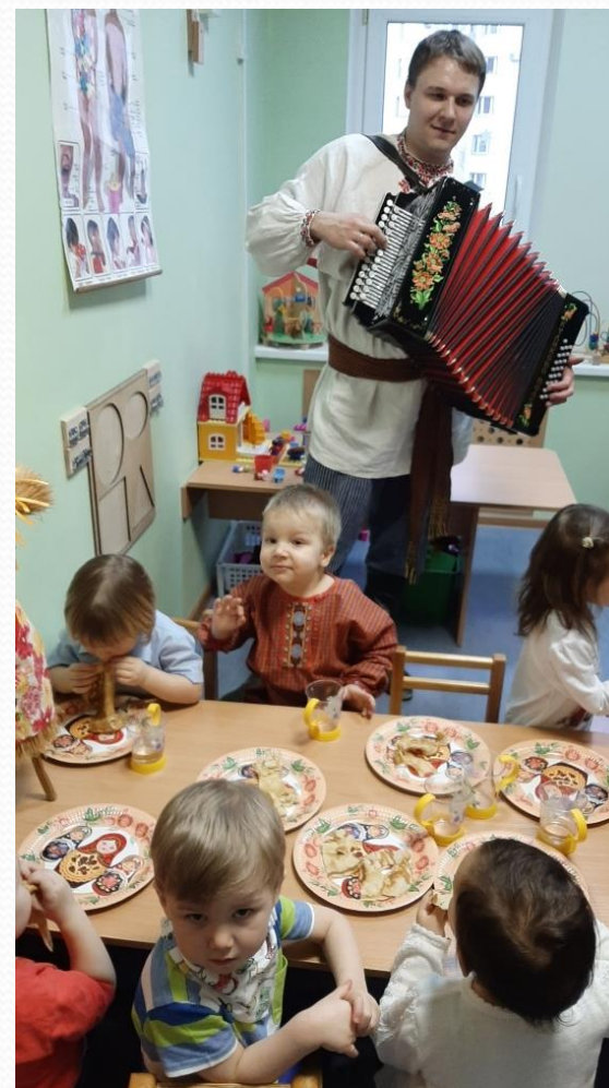
Проект «Масленица» в ГКП