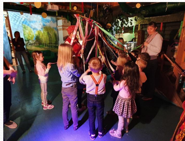
Посещение интерактивного, театрализованного мероприятия в музее «Сказкин Дом» – «Здравствуй, Масленица!»