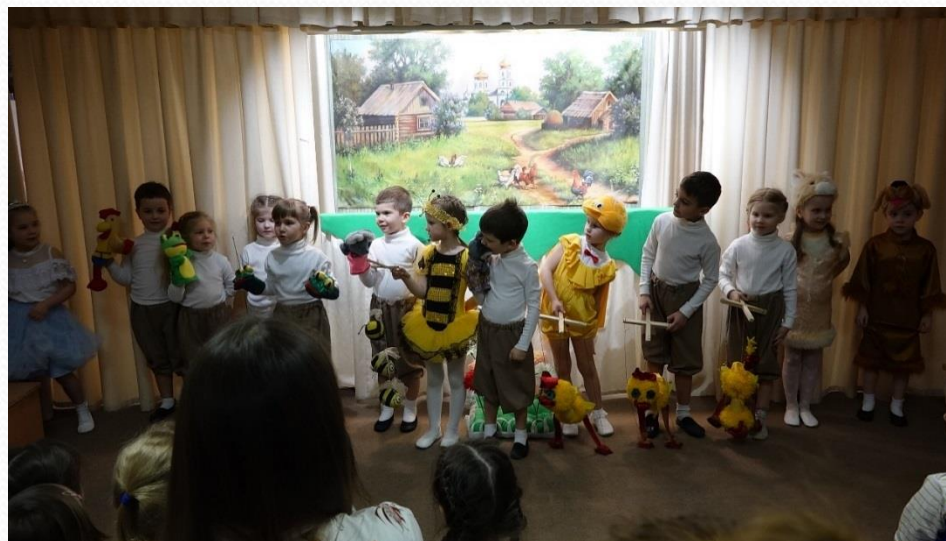
Театральная студия «Кукляндия» Спектакль «Рукавичка» 2020г.