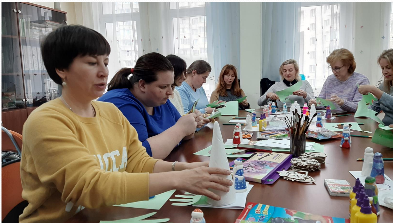
Творческая группа педагогов Приморского района «Школа молодого воспитателя»