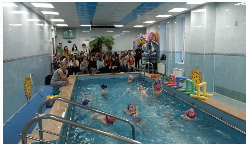
Открытое занятие педколледж