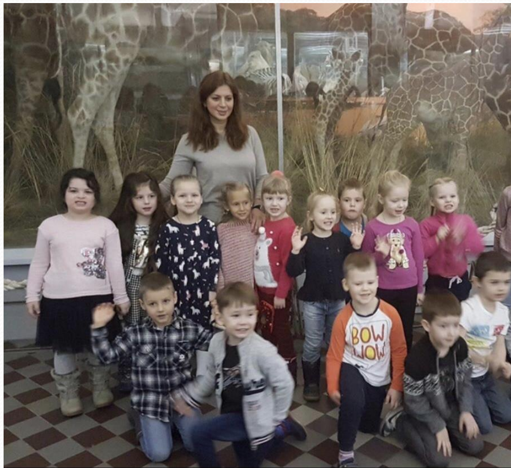
Проект «Животные». Выход в зоологический музей