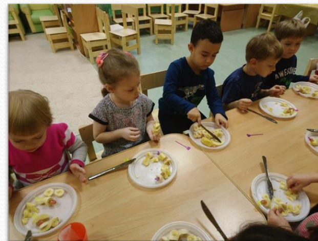
Проект «Фрукты на тарелке». Мастер-класс «Фруктовое канапе для гостей»