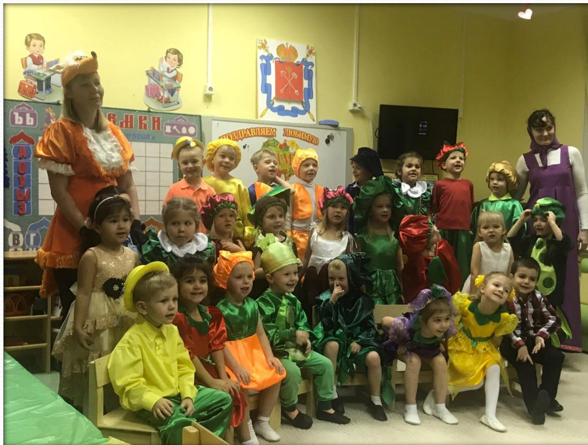
Проект «Для Вас, родители». Разучивание и показ сказок – спектаклей для родителей, педагогов и молодых специалистов