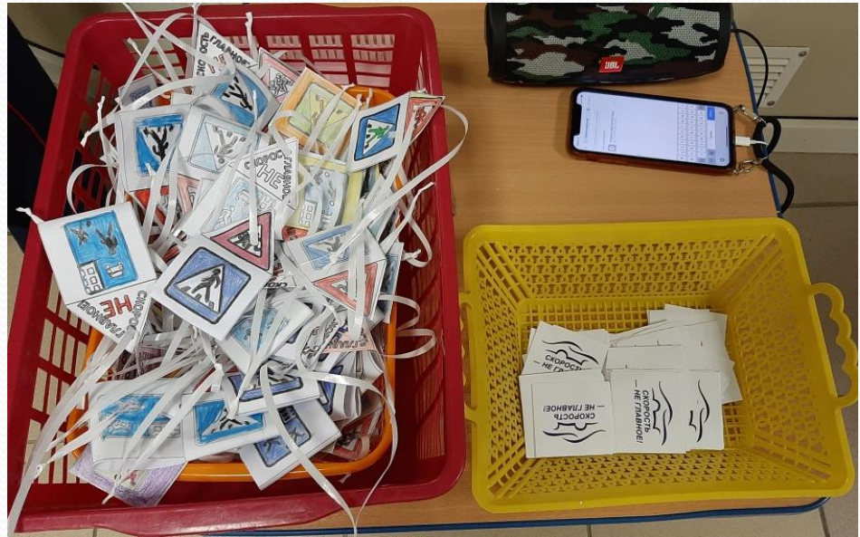
2020г. Акция «ПДД»