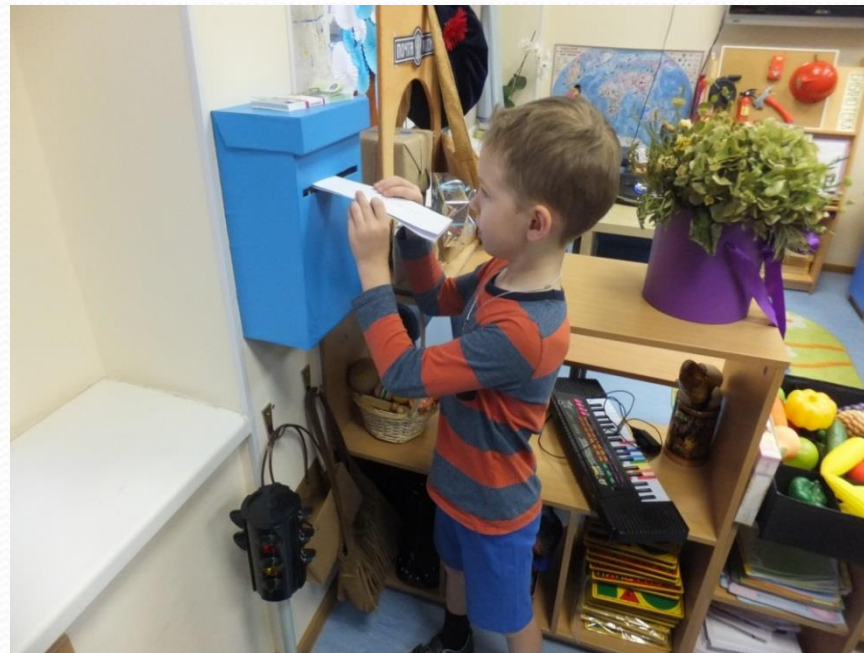
Проект «Здравствуй, Дедушка - Мороз» (подготовительная группа 1)