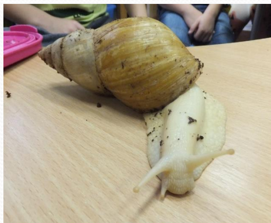
Проект «Питомцы, которые живут в нашем доме» (подготовительная группа 1)