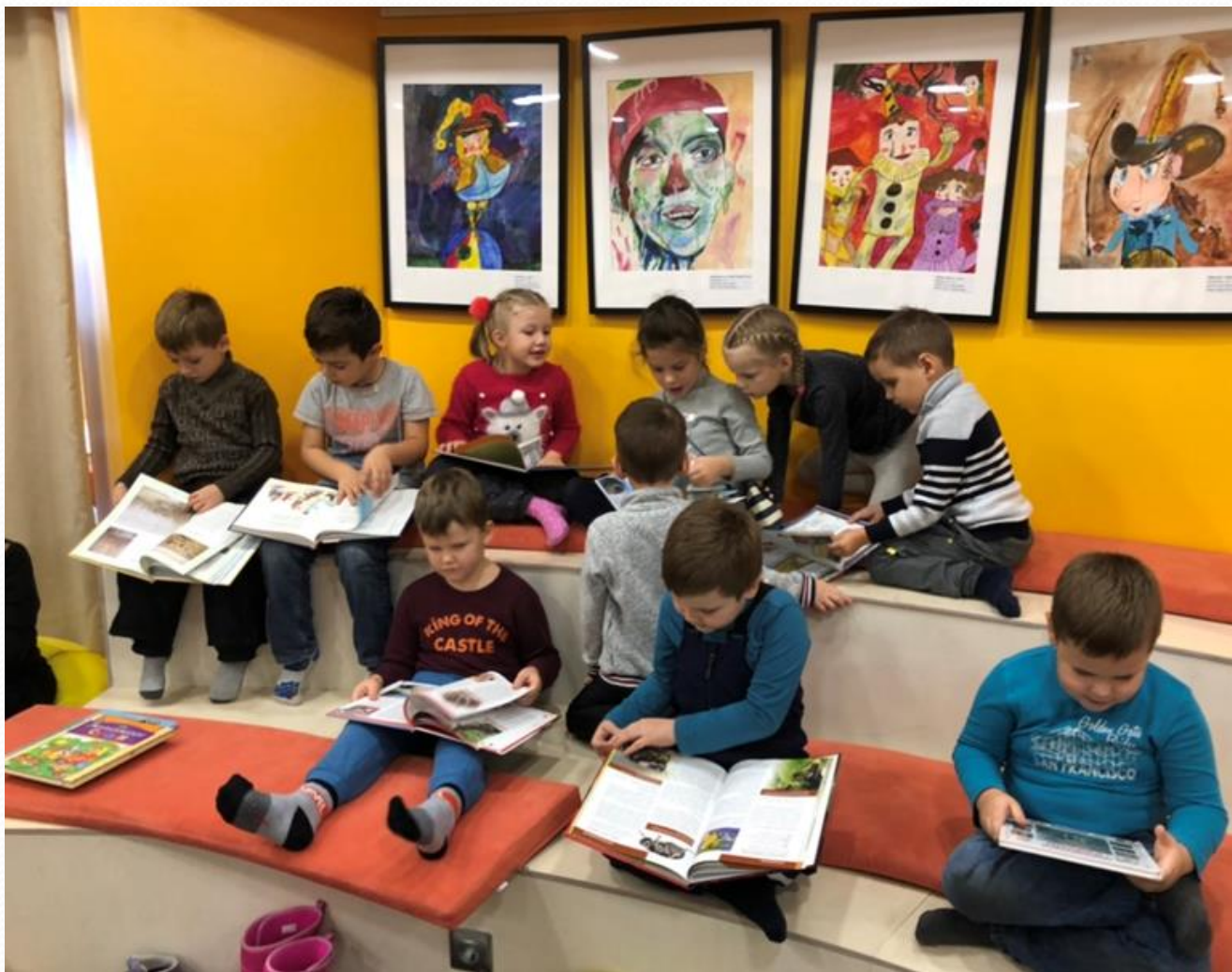
11.09.2019 г. Экскурсии в библиотеку