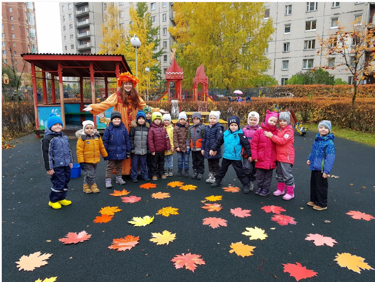
31.10.2019г. Осенние праздники