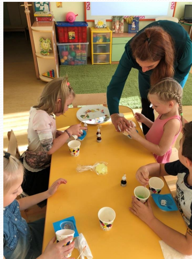
Проект «Откуда берется мыло?». мастер-класс «Мыловарение»