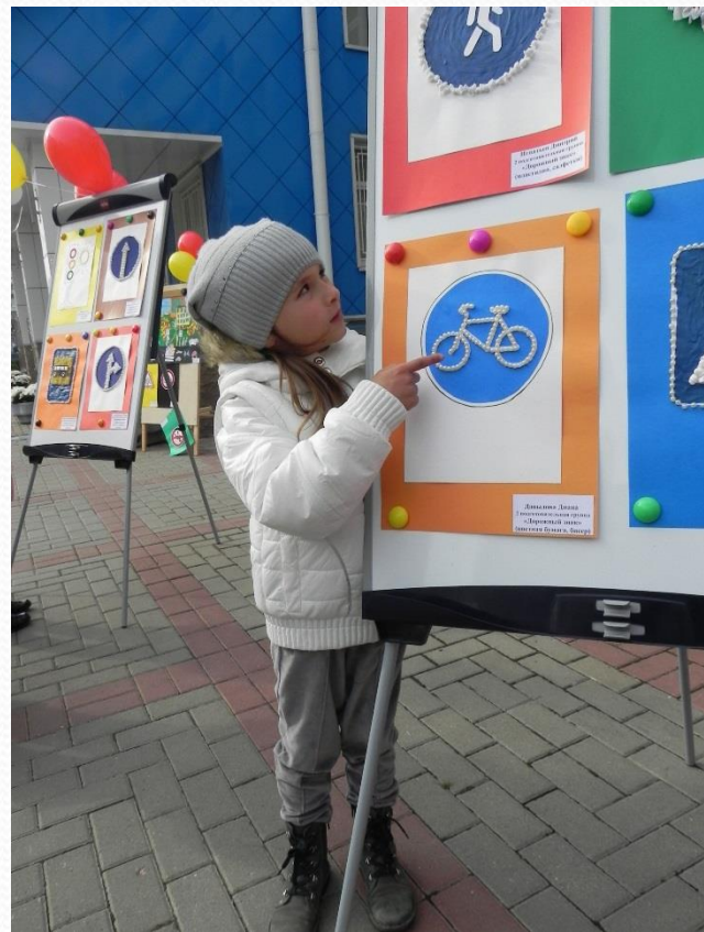
08 – 15.09. 2019 г. Социальная акция «Неделя безопасности дорожного движения»