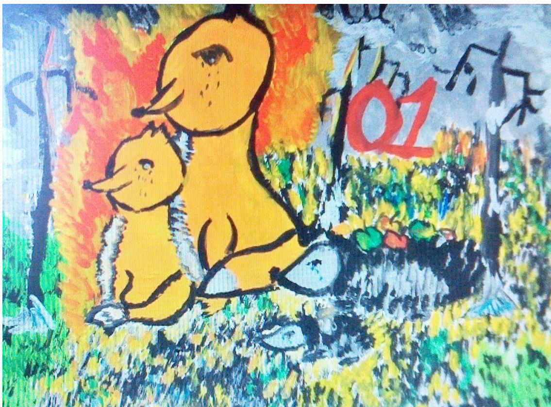
Ноябрь, 2019г. Социальная акция «Будь осторожен с огнём»