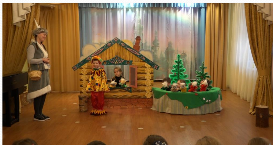
Кукляндия Спектакль «Белоснежка и 7 гномов», «Волк и семеро козлят» 2020г.?