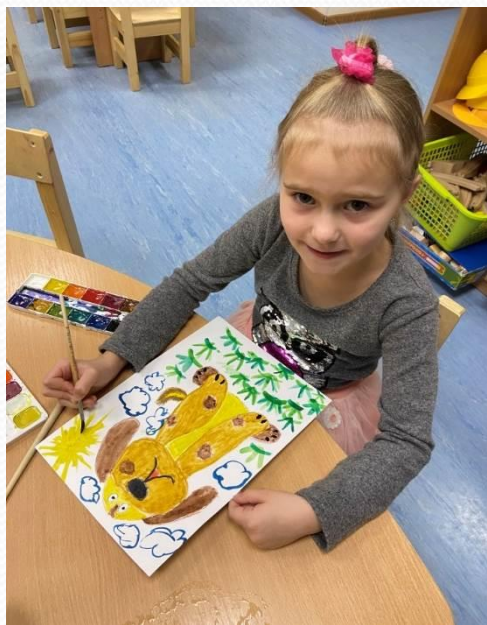
Проект «Животные на службе у человека»