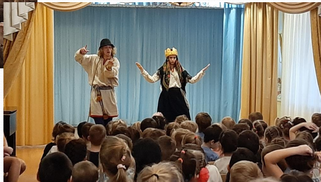
Спектакль «Золотая рыбка»