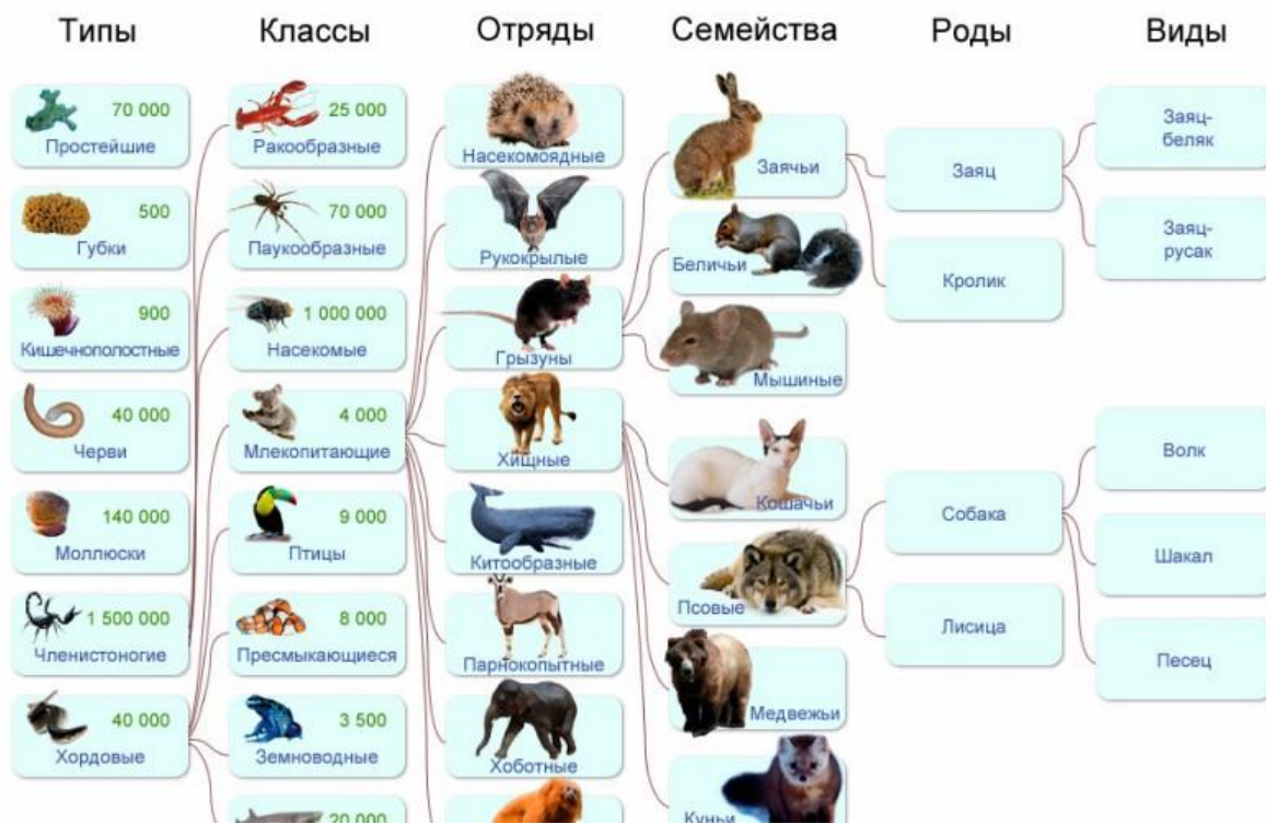
Рисунок 3. Классы животных

Детям предлагается создать картину под руководством педагога, проговаривая названия животных и повторяя к какому классу он относится (См. Рисунок 3).