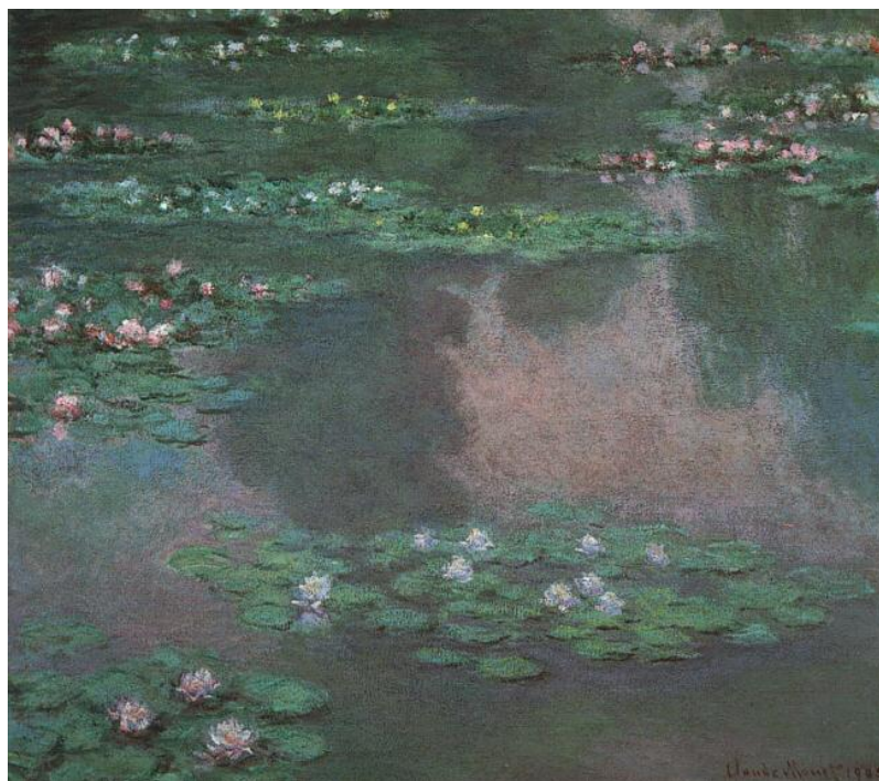
Рисунок 2. Клод Моне «Водяные лилии (кувшинки)»