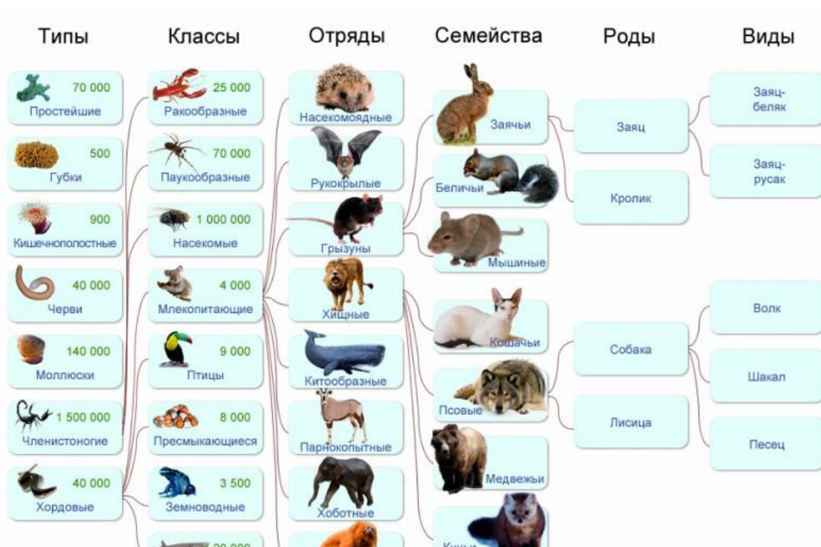
Рисунок 3. Классы животных

Детям предлагается создать картину под руководством педагога, проговаривая названия животных и повторяя к какому классу он относится (См. Рисунок 3).