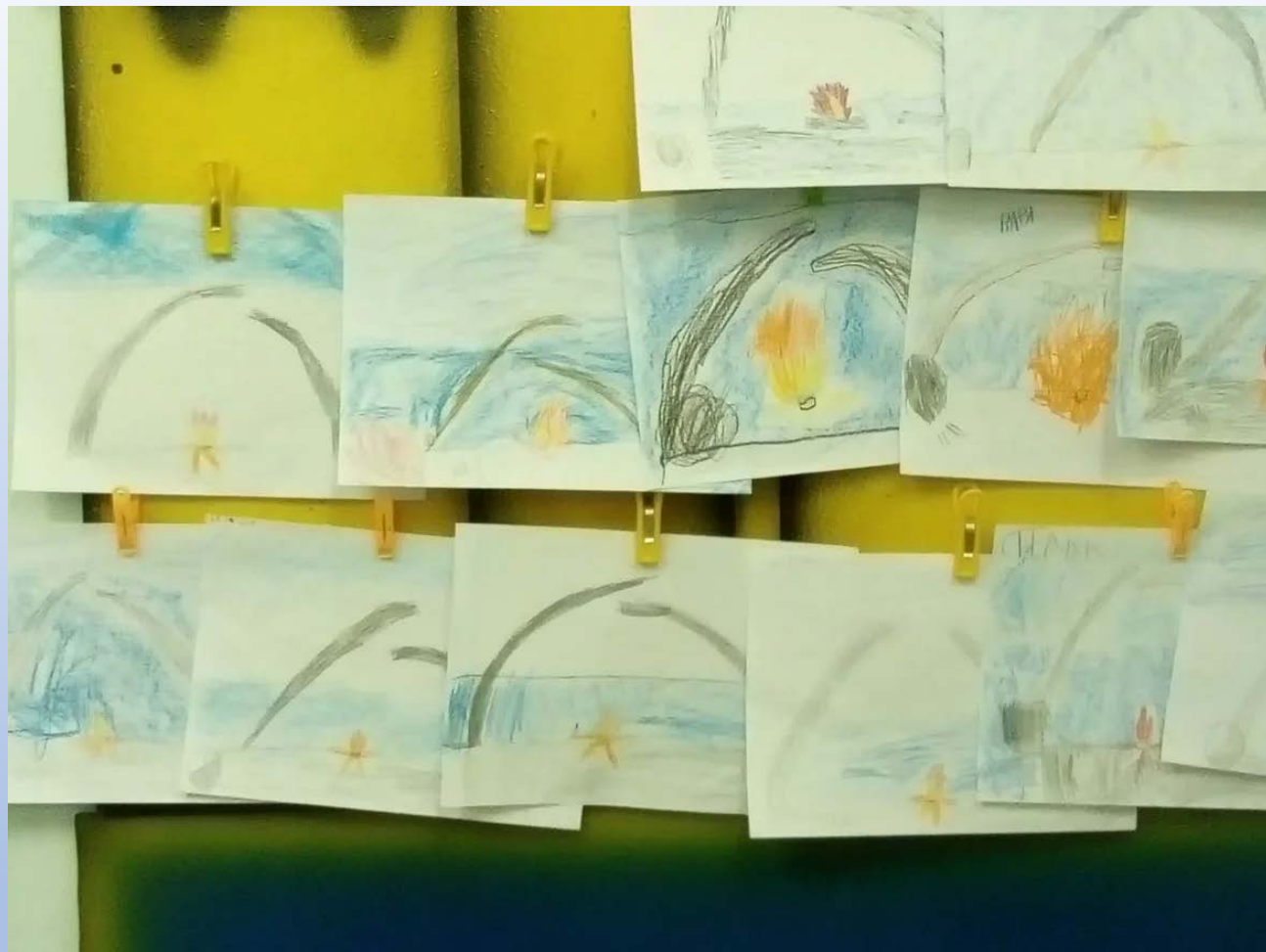
Рисование в рамках НОД «Мемориальный комплекс «Разорванное кольцо»