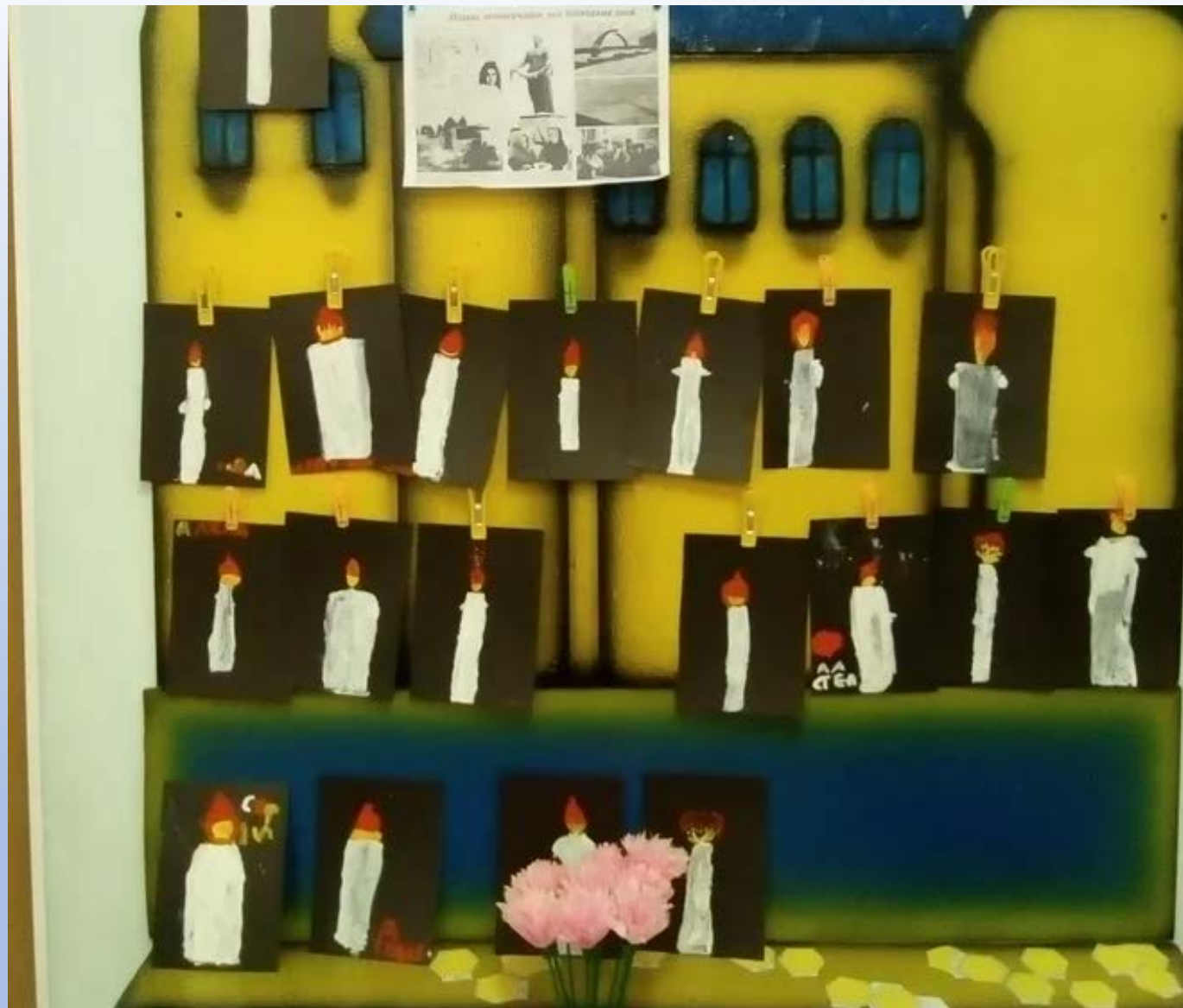
Участие в акции «Свеча памяти» в память о погибших жителях Ленинграда