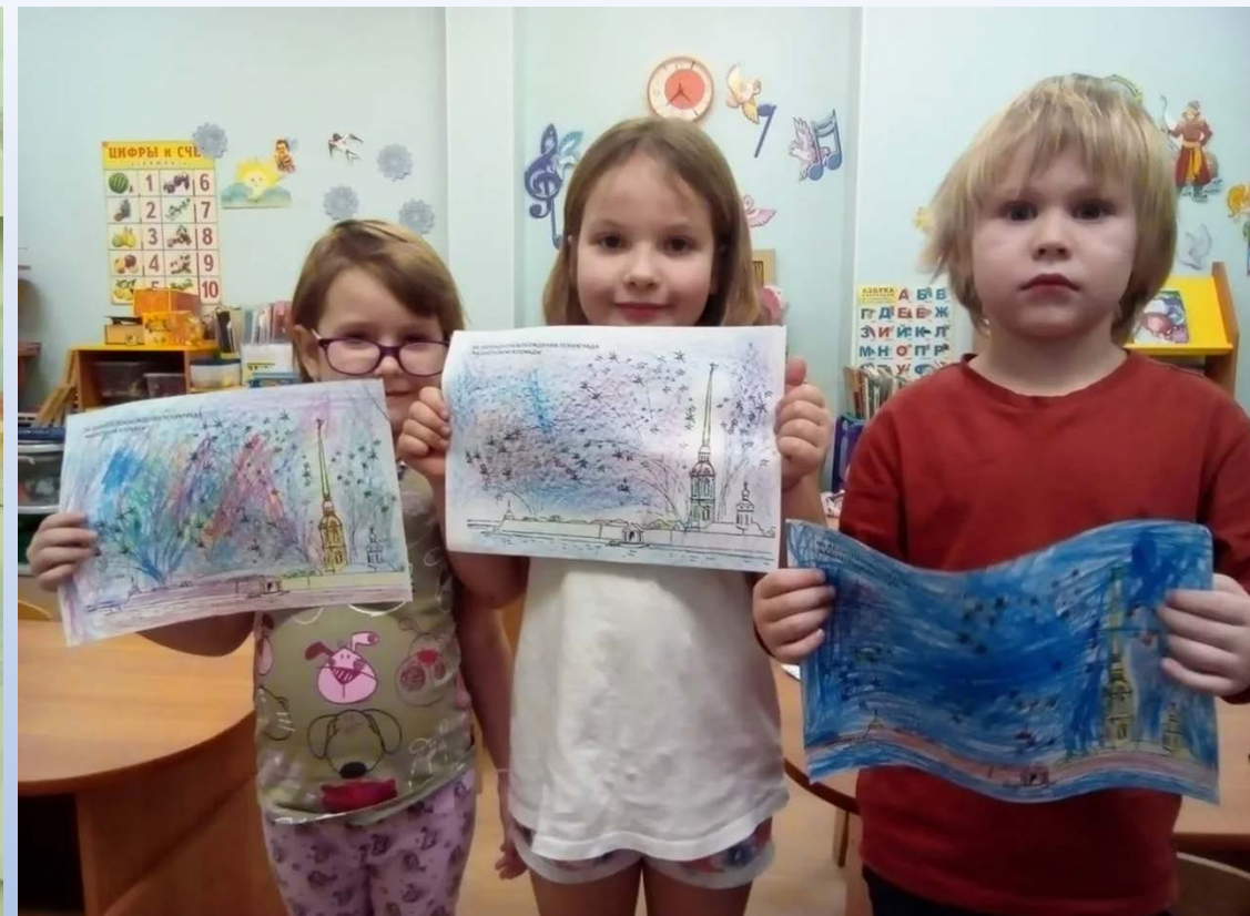
Раскрашивание в досуговой деятельности «Салют победы»