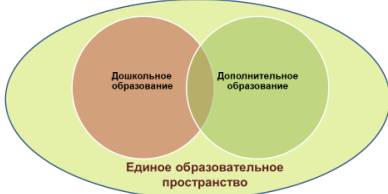
Модель интеграции дошкольного и дополнительного образования в условиях современной ДОО

есть процесс и результат создания неразрывно связанного, единого, цельного.