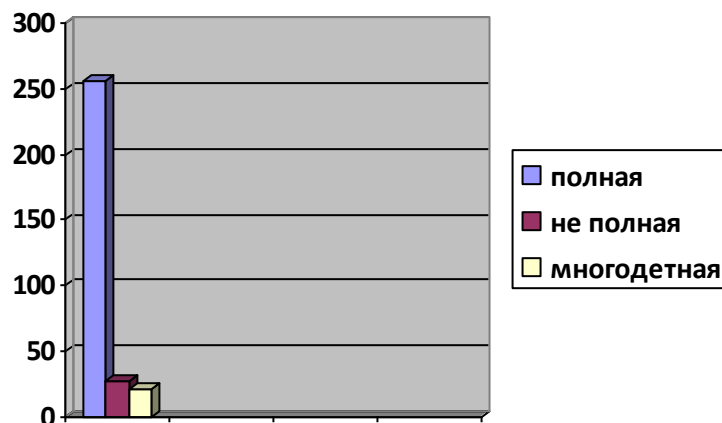
Гистограмма 2. Социальный статус семьи