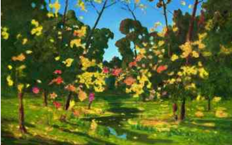
Рисунок 1. Архип Иванович Куинджи «Осень»

Педагог показывает детям репродукцию картины Архипа Ивановича Куинджи «Осень» (См. Рисунок 1), дает краткое описание произведения изобразительного искусства по схеме (См. Приложение 12).