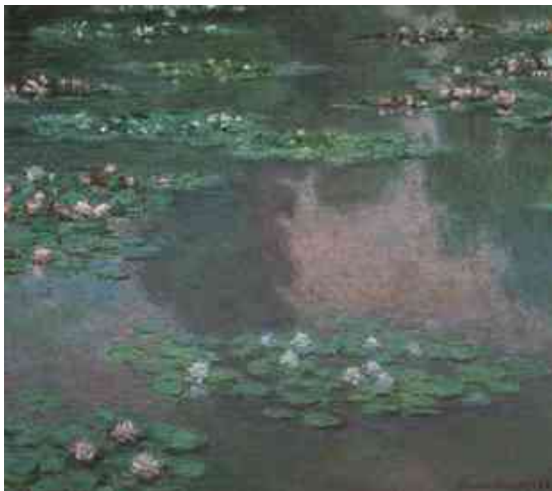
Рисунок 2. Клод Моне «Водяные лилии (кувшинки)»

Педагог показывает детям репродукцию картины Клода Моне «Водяные лилии (кувшинки)», дает краткое описание произведения изобразительного искусства по схеме (См. Рисунок 2).