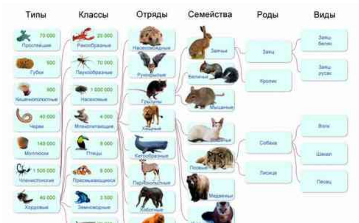
Рисунок 3. Классы животных

Детям предлагается создать картину под руководством педагога, проговаривая названия животных и повторяя к какому классу он относится (См. Рисунок 3).