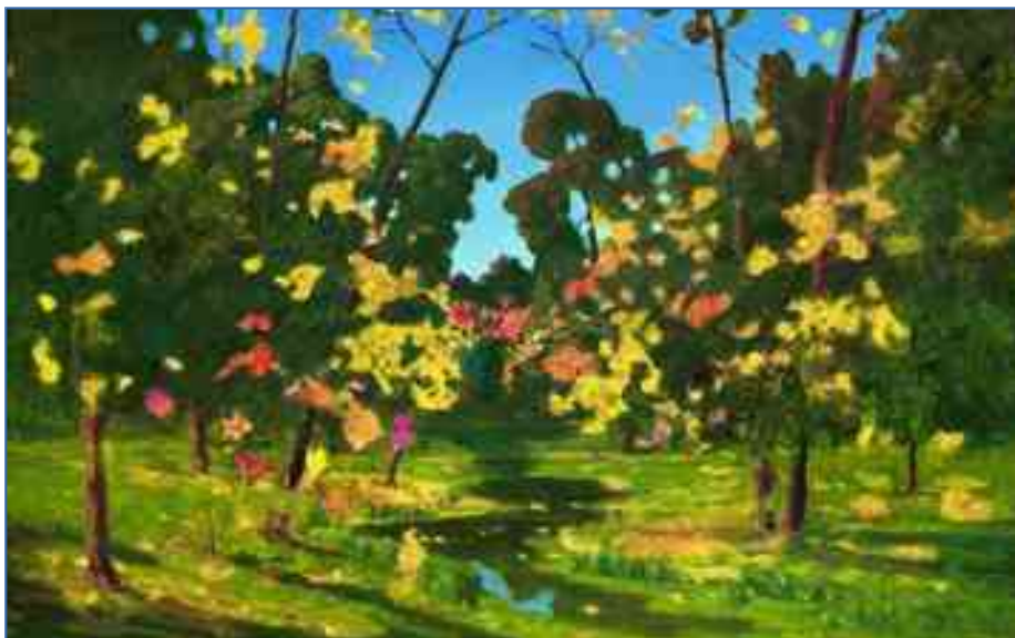
Рисунок 1. Архип Иванович Куинджи «Осень»

Педагог показывает детям репродукцию картины Архипа Ивановича Куинджи «Осень» (См. Рисунок 1), дает краткое описание произведения изобразительного искусства по схеме (См. Приложение 12).