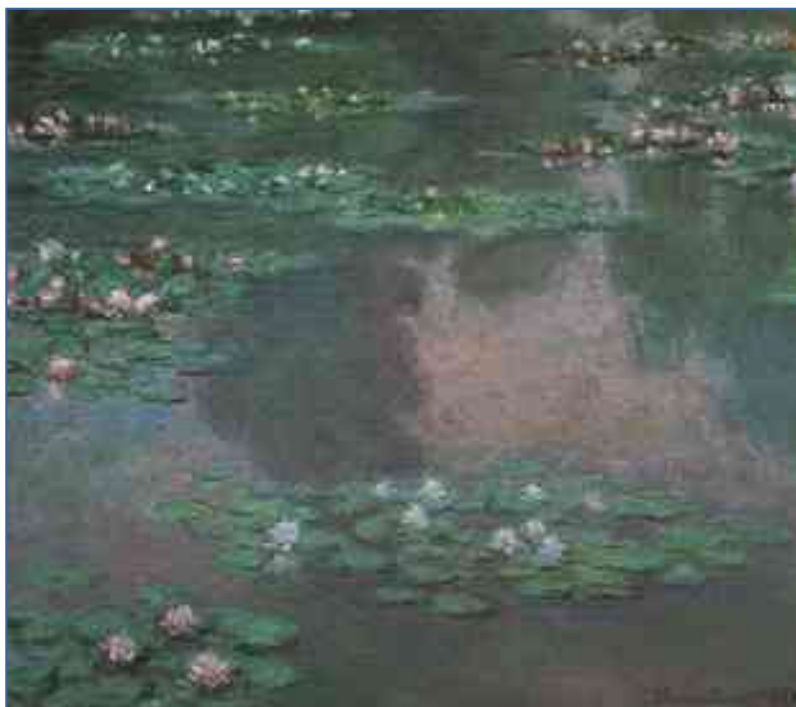
Рисунок 2. Клод Моне «Водяные лилии (кувшинки)»

Педагог показывает детям репродукцию картины Клода Моне «Водяные лилии (кувшинки)», дает краткое описание произведения изобразительного искусства по схеме (См. Рисунок 2).