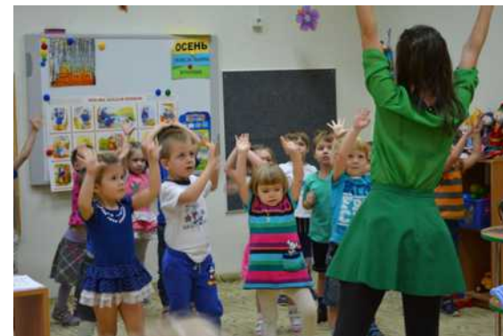
«Исюминка» 2013-2014 учебного года – танцевальные «пятиминутки»