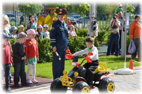
Мероприятие по ПДД ко дню защиты детей