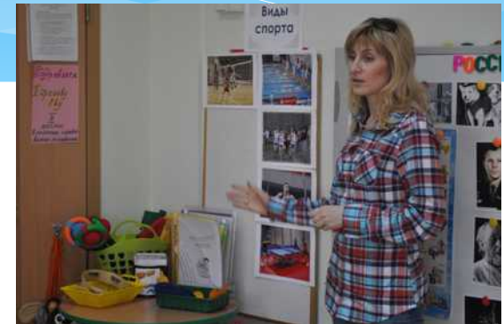
В ГБДОУ проходят районные научно-практические семинары по оздоровлению детей