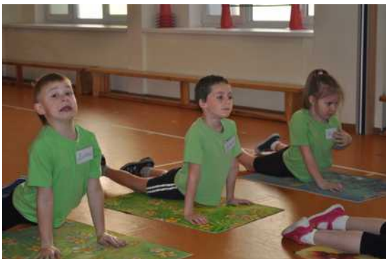
На базе сада проходил районный этап конкурса «Учитель здоровья»