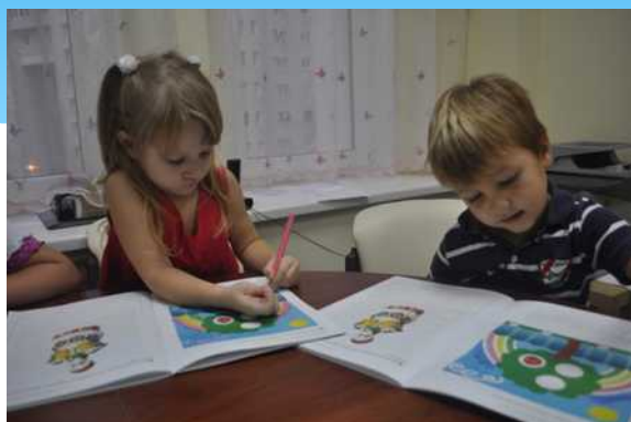
Музейный педагог проводит занятия с детьми

«Русский музей: виртуальный филиал» открыт 10 февраля 2012 года.