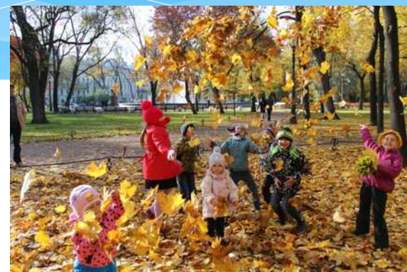
Практикуются выезды с детьми на экспозиции Русского музея, исторические места Санкт-Петербурга