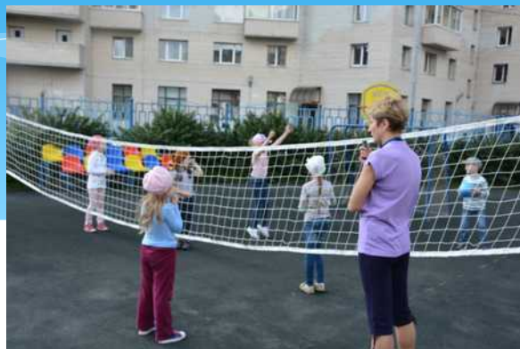
Станция «Веселый волейбол» (инструктор ФК С.В. Удалова)