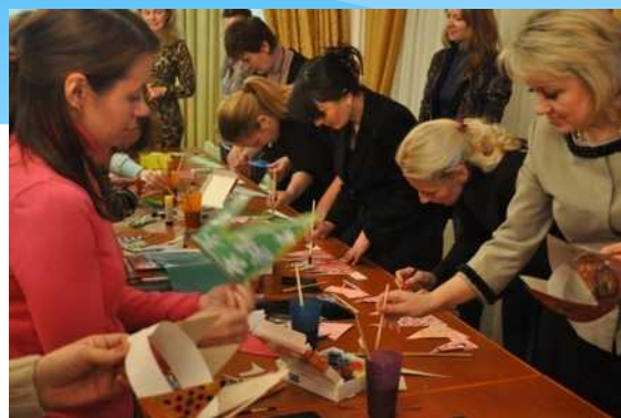
На базе детского сада проходят семинар по музейной педагогике с показом мастер-класса