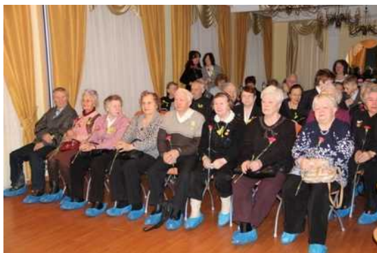
В детском саду организованы концерты для ветеранов ВОВ (сентябрь, январь, апрель)