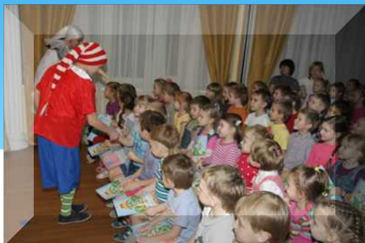
Буратино с другом Пьеро

Посмотрев спектакль «Буратино в стране дорожных знаков». Дети получили необходимые знания, а также удовольствие от игры юных актёров.