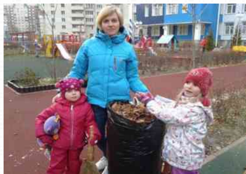
Осенний и весенний субботники