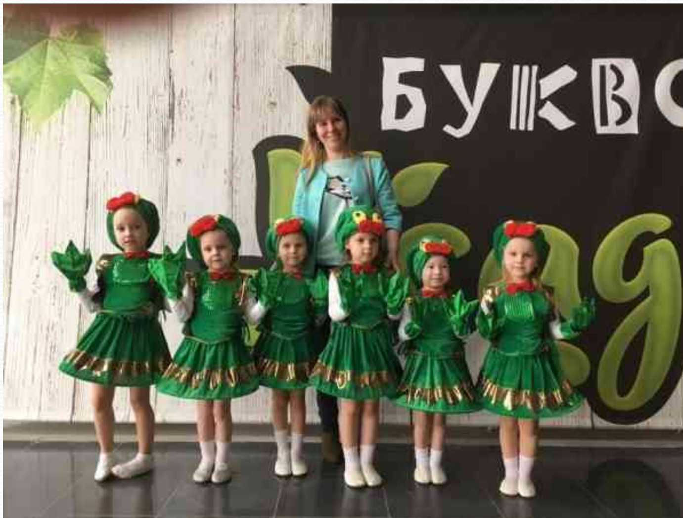
Победа воспитанников на городском проекте «Фестиваль детства» (апрель 2017г.)