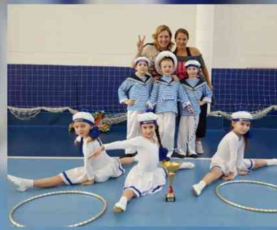
Победитель районного соревнования по спортивному танцу (апрель 2017г.)