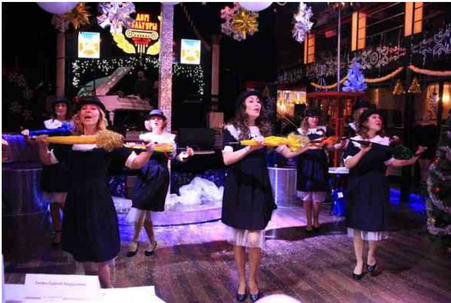
Диплом лауреата I степени в муниципальном конкурсе «Битва хоров» среди коллективов ТФОУ и ТБДОУ (МО «Озеро Долгое», декабрь 2016 г.)