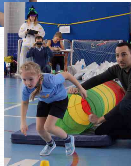
Призер районных соревнований среди ГБДОУ Приморского района «Веселые старты» (март 2017г.)