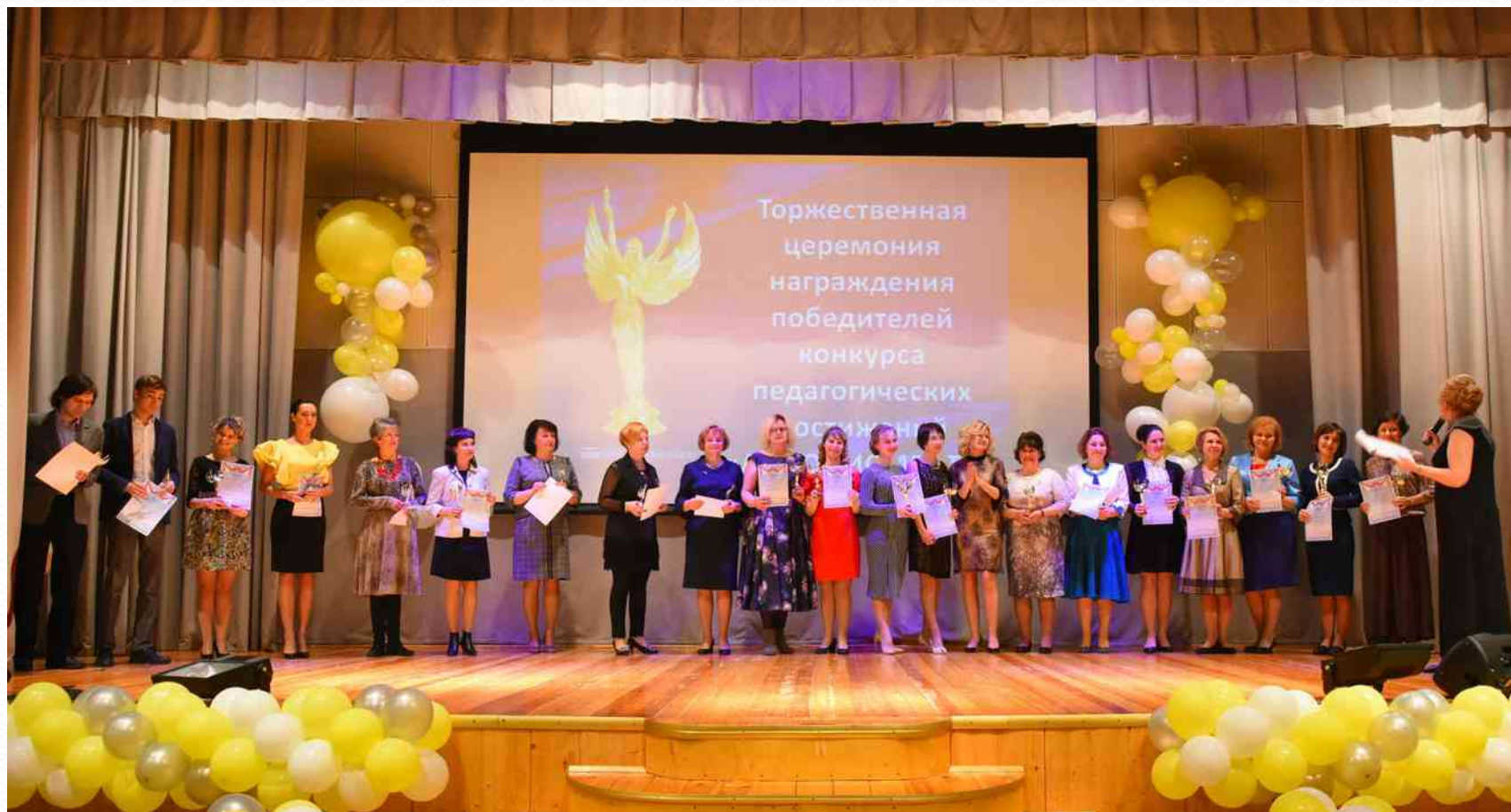
Победитель межрайонного конкурса инновационных продуктов «ЛУЧШИЙ ИННОВАЦИОННЫЙ ПРОДУКТ» Номинация «Образовательная деятельность» (апрель 2017г.)