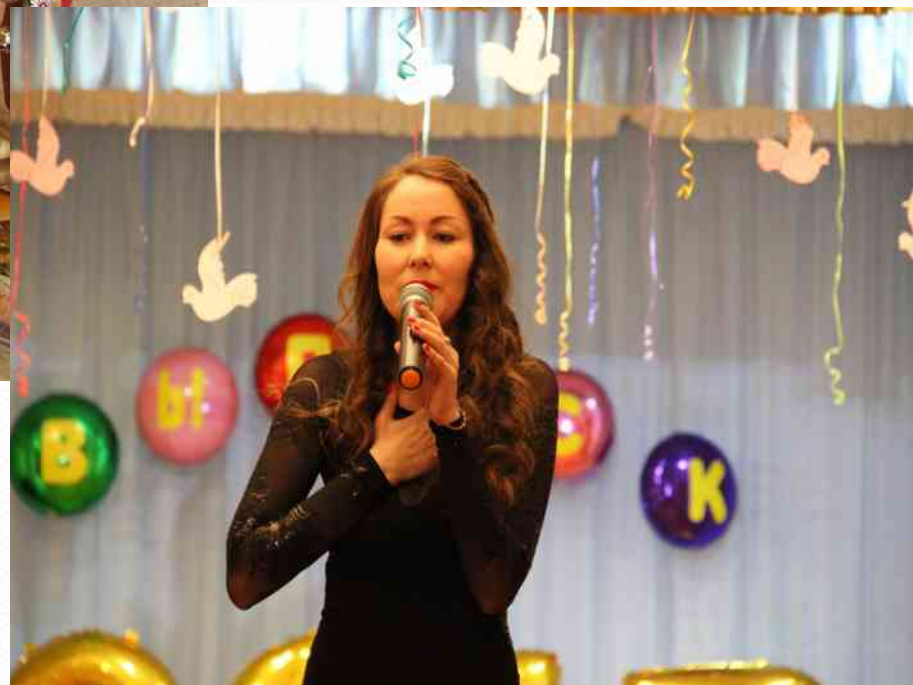
Лауреат III степени районного конкурса «Вершина мастерства» Номинация «Музыкальный руководитель» (февраль 2017 г.)